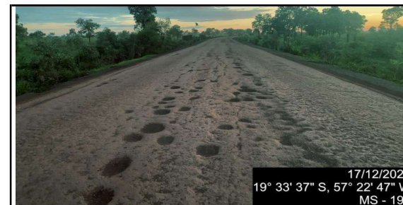
Foto 09 MS-197

17/12/2025 19° 33' 37" S, 57° 22' 47" W MS - 197