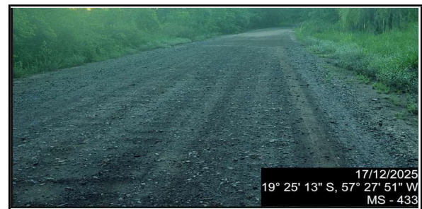
Foto 10 MS-433