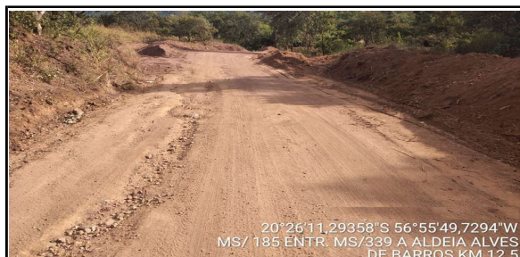
Foto 04 MS-185