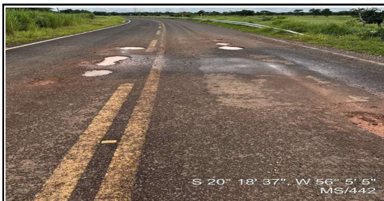
Foto 11 MS-442