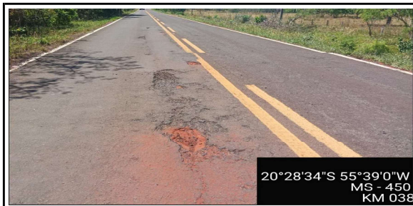
Foto 16 MS-450