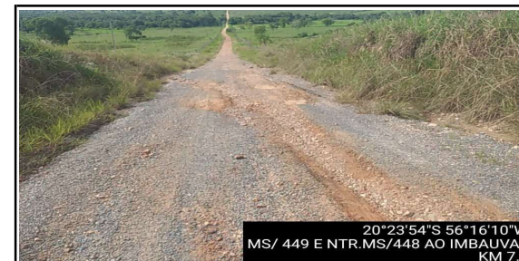
Foto 15 MS-449