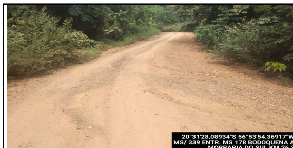
Foto 05 MS-339