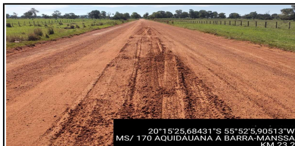
Foto 01 MS-170