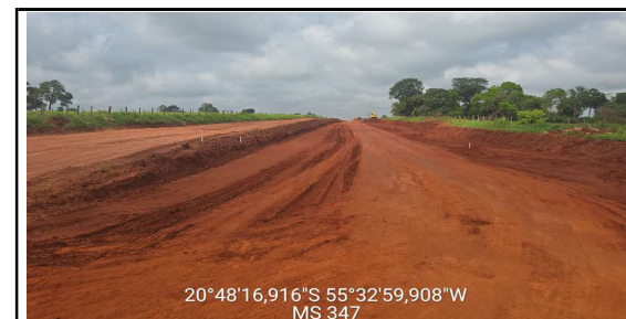
Foto 09 MS-347