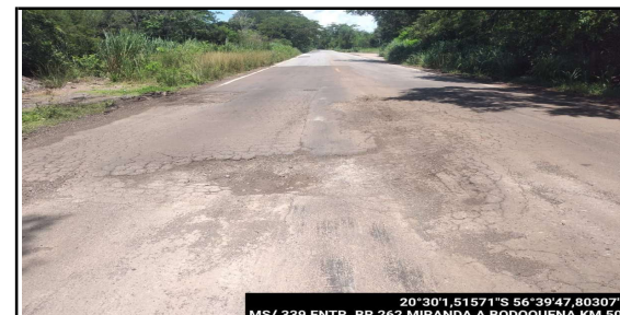
Foto 06 MS-339