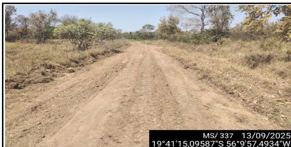
Foto 10 MS-337