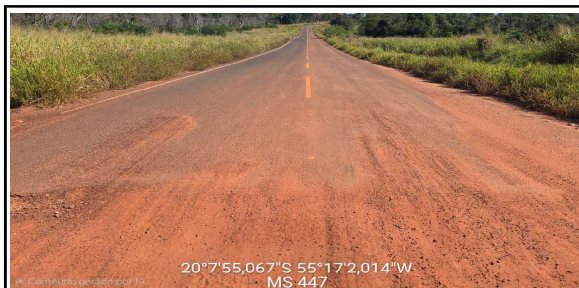
Foto 13 MS-447