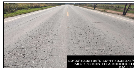
Foto 03 MS-178