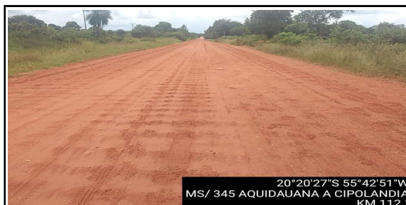
Foto 08 MS-345