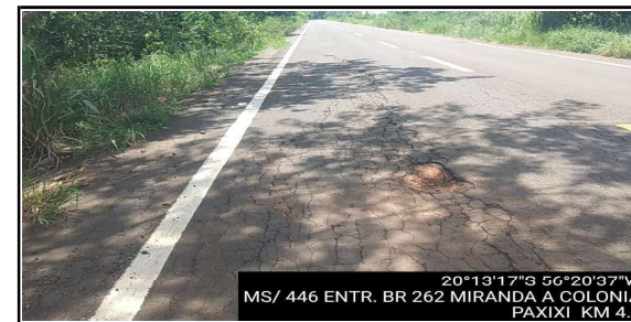
Foto 12 MS-446