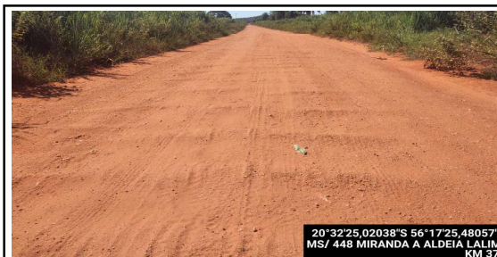
Foto 14 MS-448