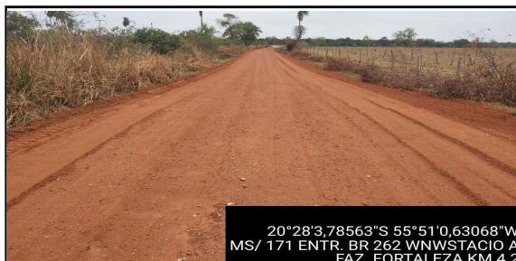
Foto 02 MS-171