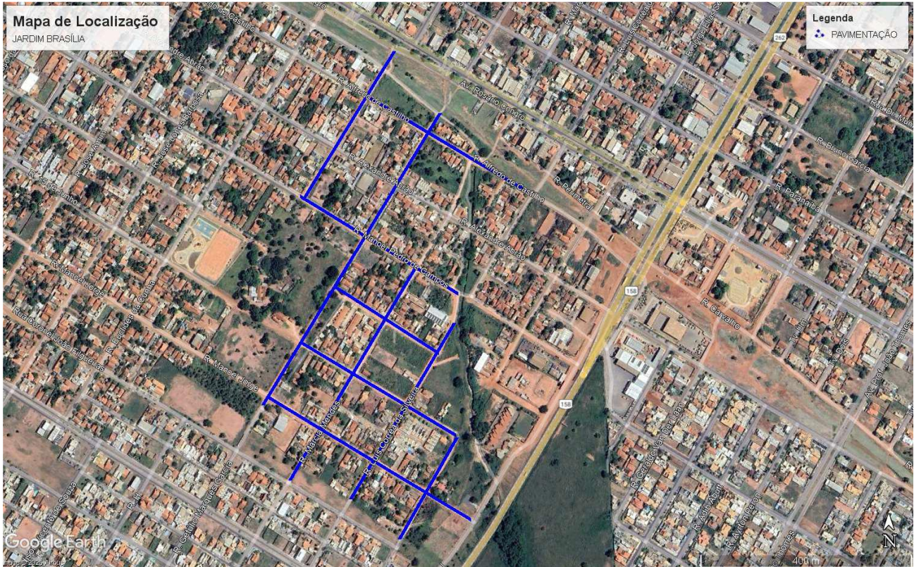
Figura 01 – Localização