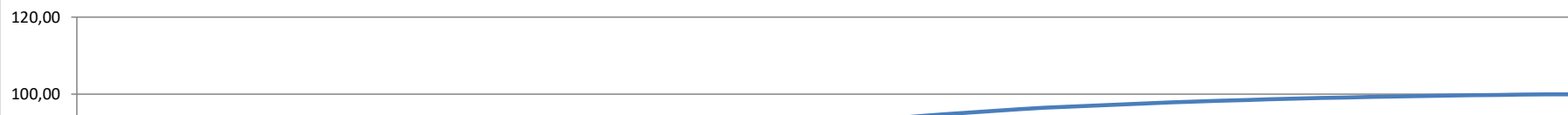
Gráfico da Curva ABC - Serviços ligados diretamente ao orçamento