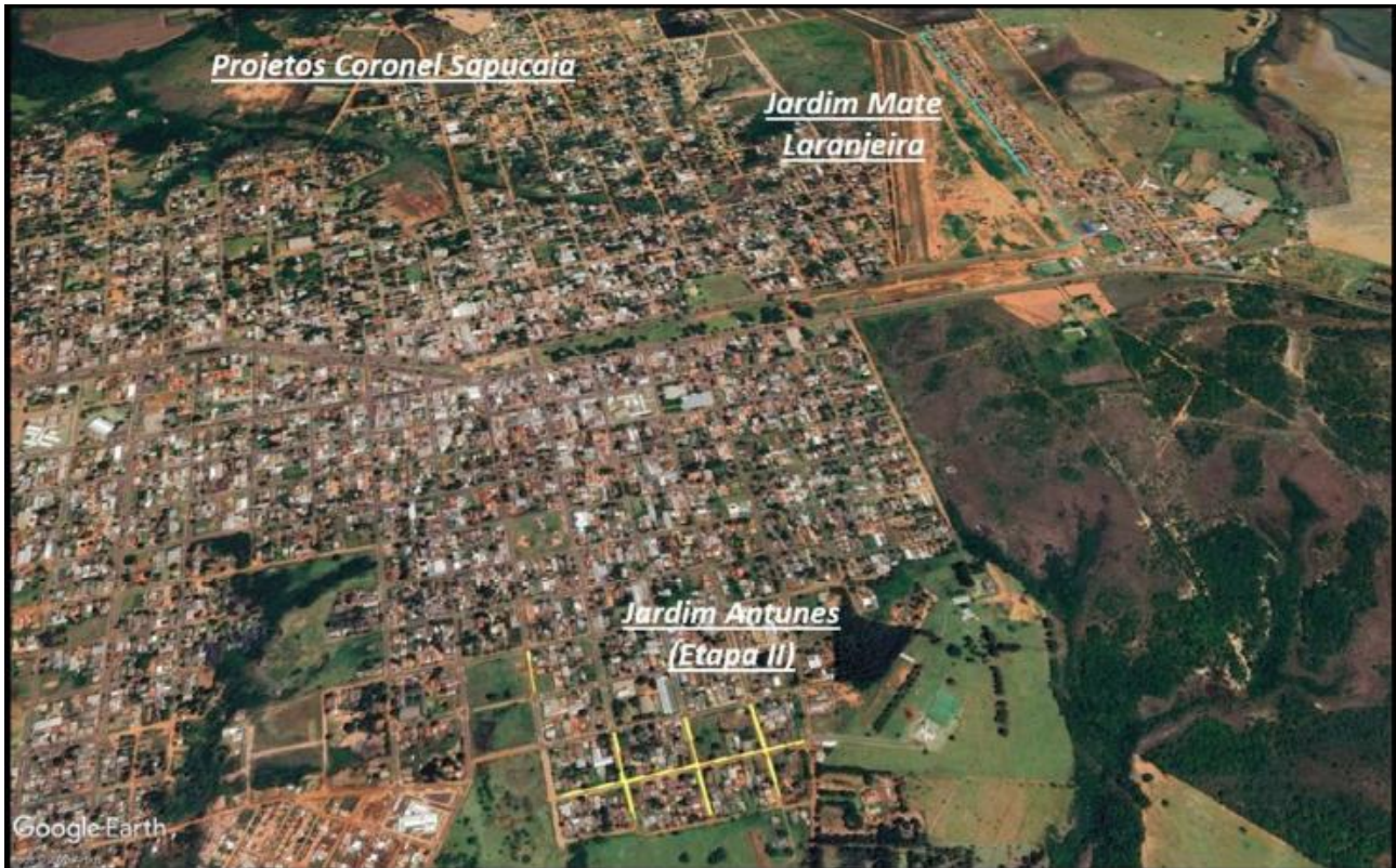
.Figura 01 – Localização