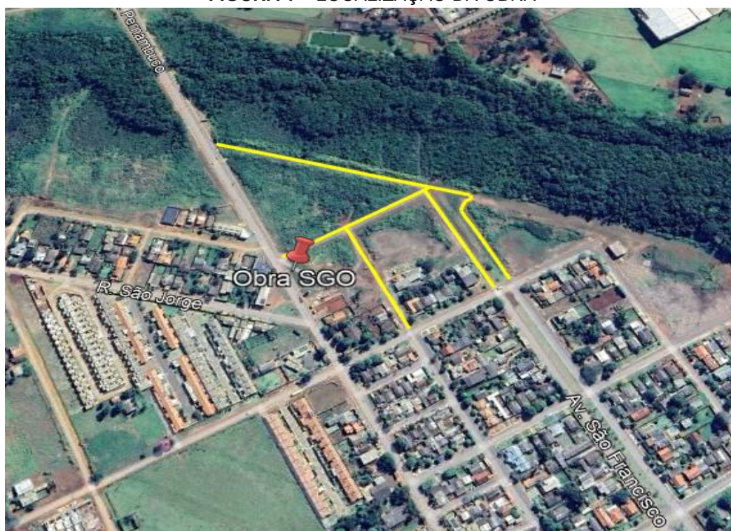
FIGURA 1 – LOCALIZAÇÃO DA OBRA