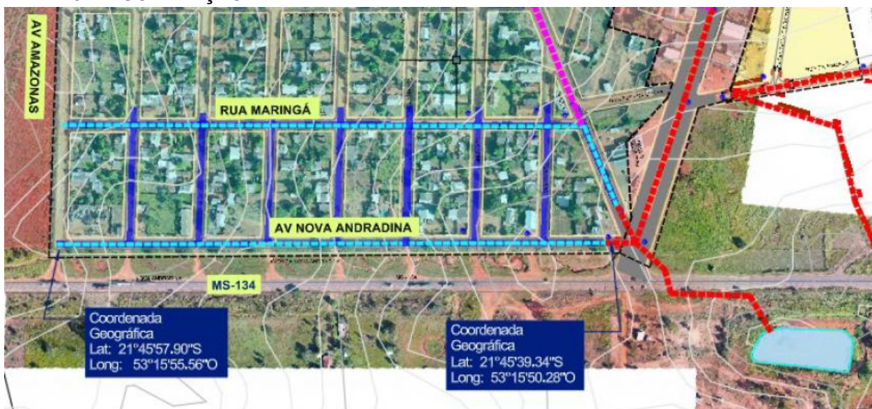
FIGURA 1 – LOCALIZAÇÃO DA OBRA