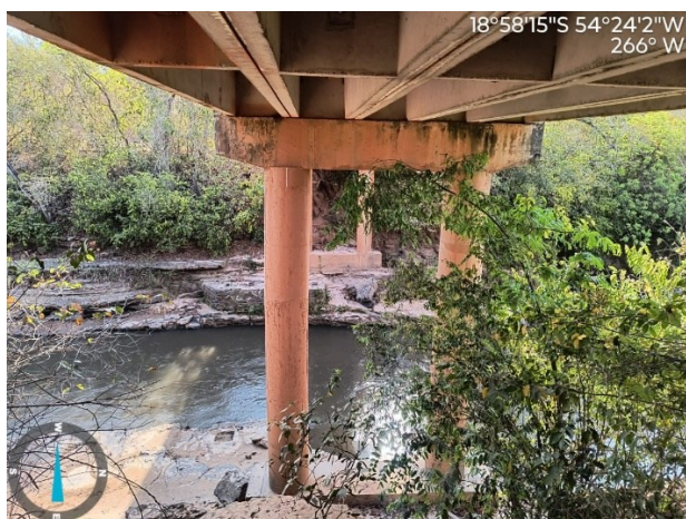
Figura 04: Ponte de Concreto – Rio Coxim