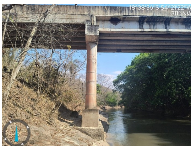
Figura 05: Ponte de Concreto – Rio Jauru