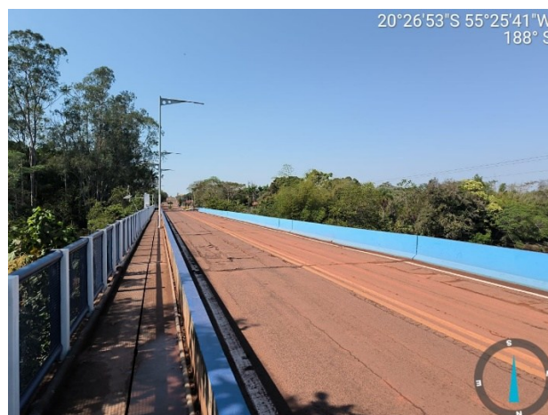
Figura 07: Ponte de Concreto – Rio Aquidauana Palmeiras