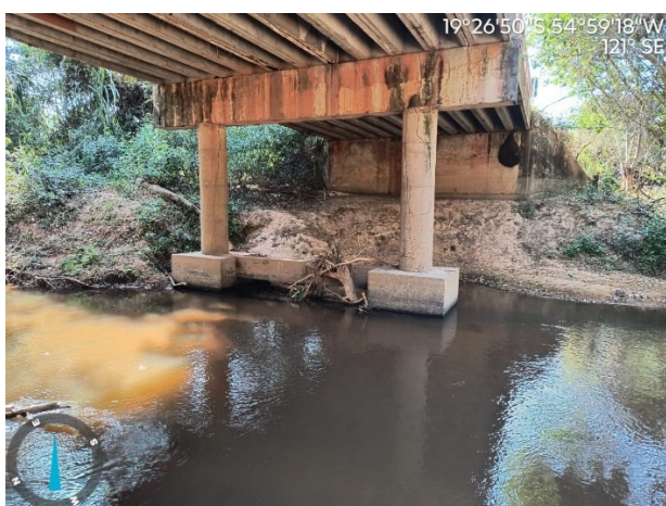
Figura 06: Ponte de Concreto – Rio Garimpo