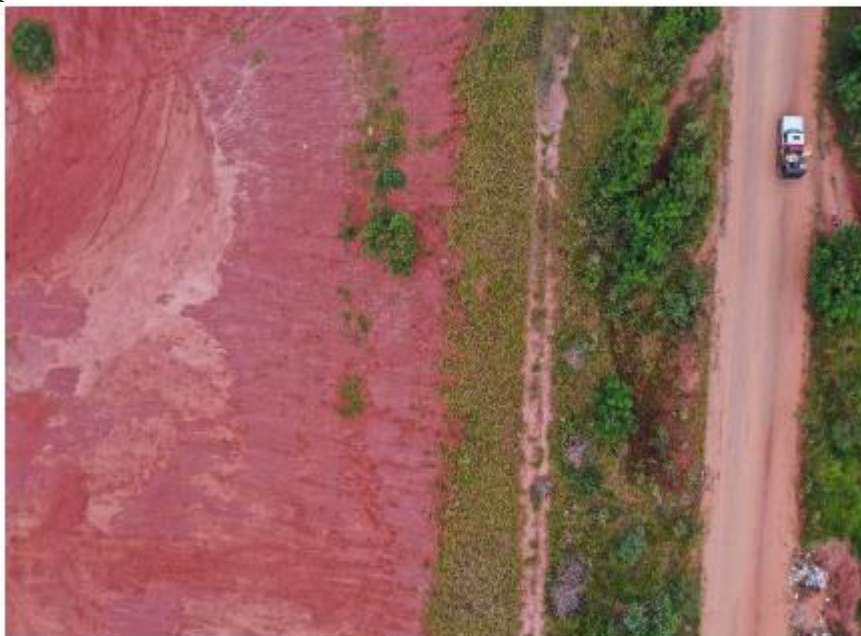
Imagem 3: Imagem aérea do local da obra