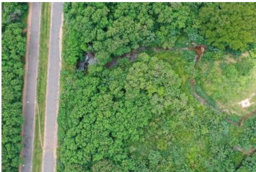
Imagem 2: Imagem aérea do local da obra