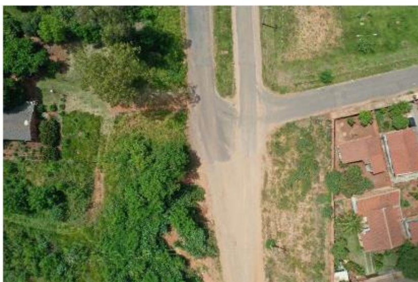
Imagem 4: Imagem aérea do local da obra