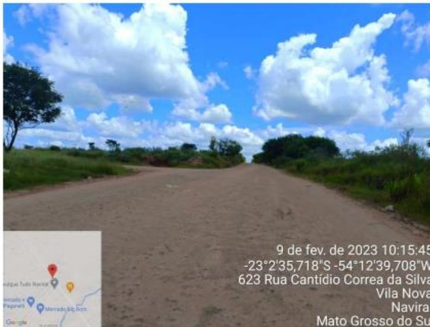
Imagem 5: Foto do local da área de interesse