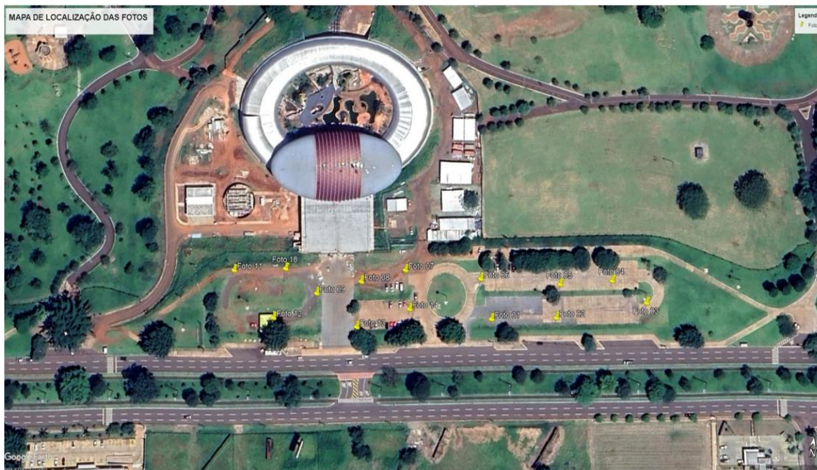
FIGURA 1 – LOCALIZAÇÃO DA OBRA