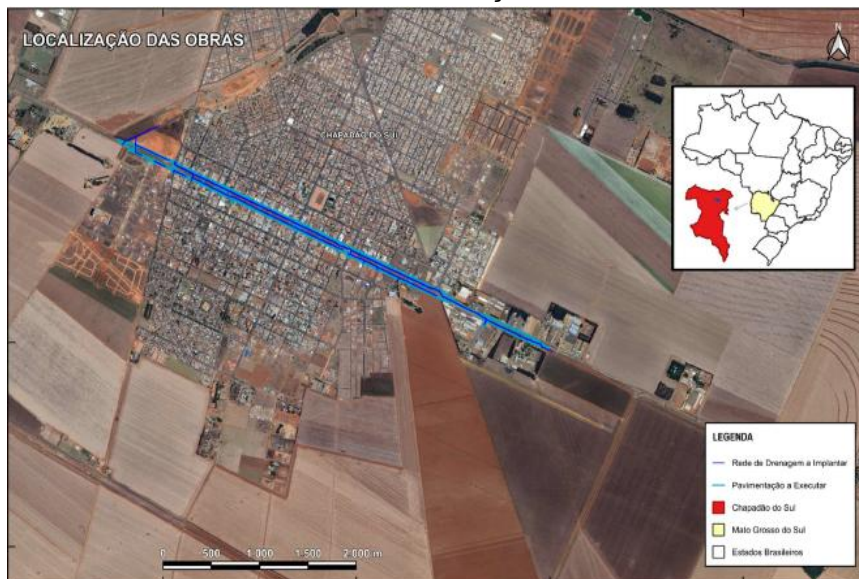
FIGURA 1 – LOCALIZAÇÃO DA OBRA