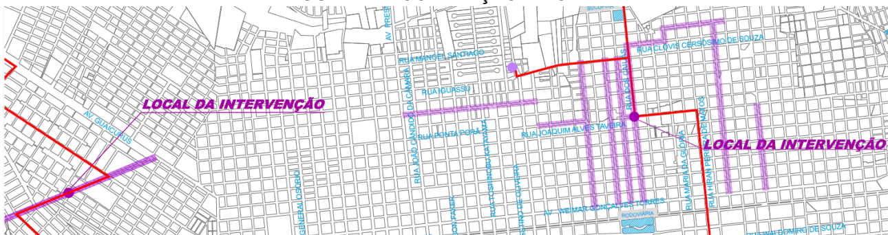
FIGURA 1 – LOCALIZAÇÃO DA OBRA