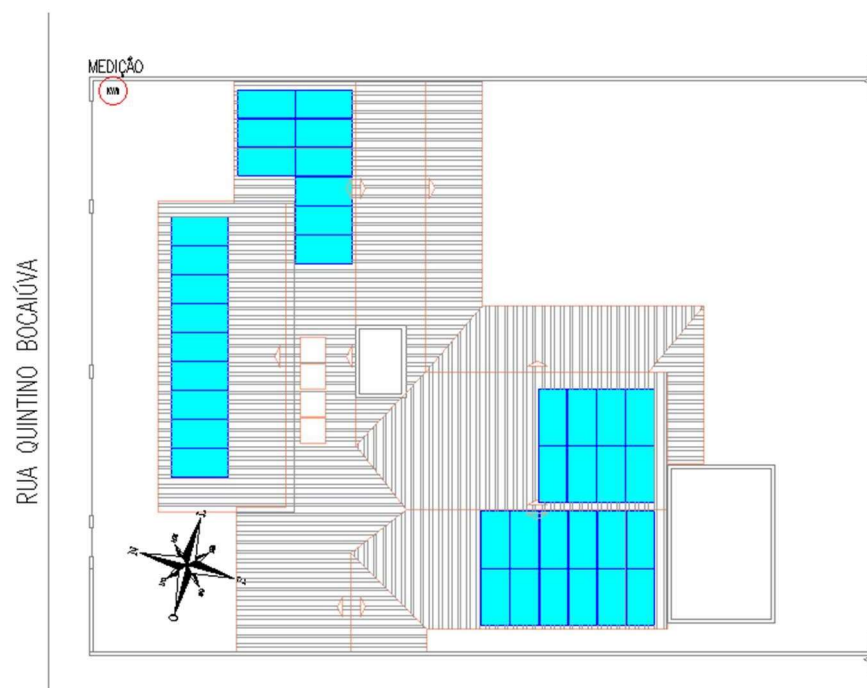
Figura 1 – Layout da Usina a ser implantada