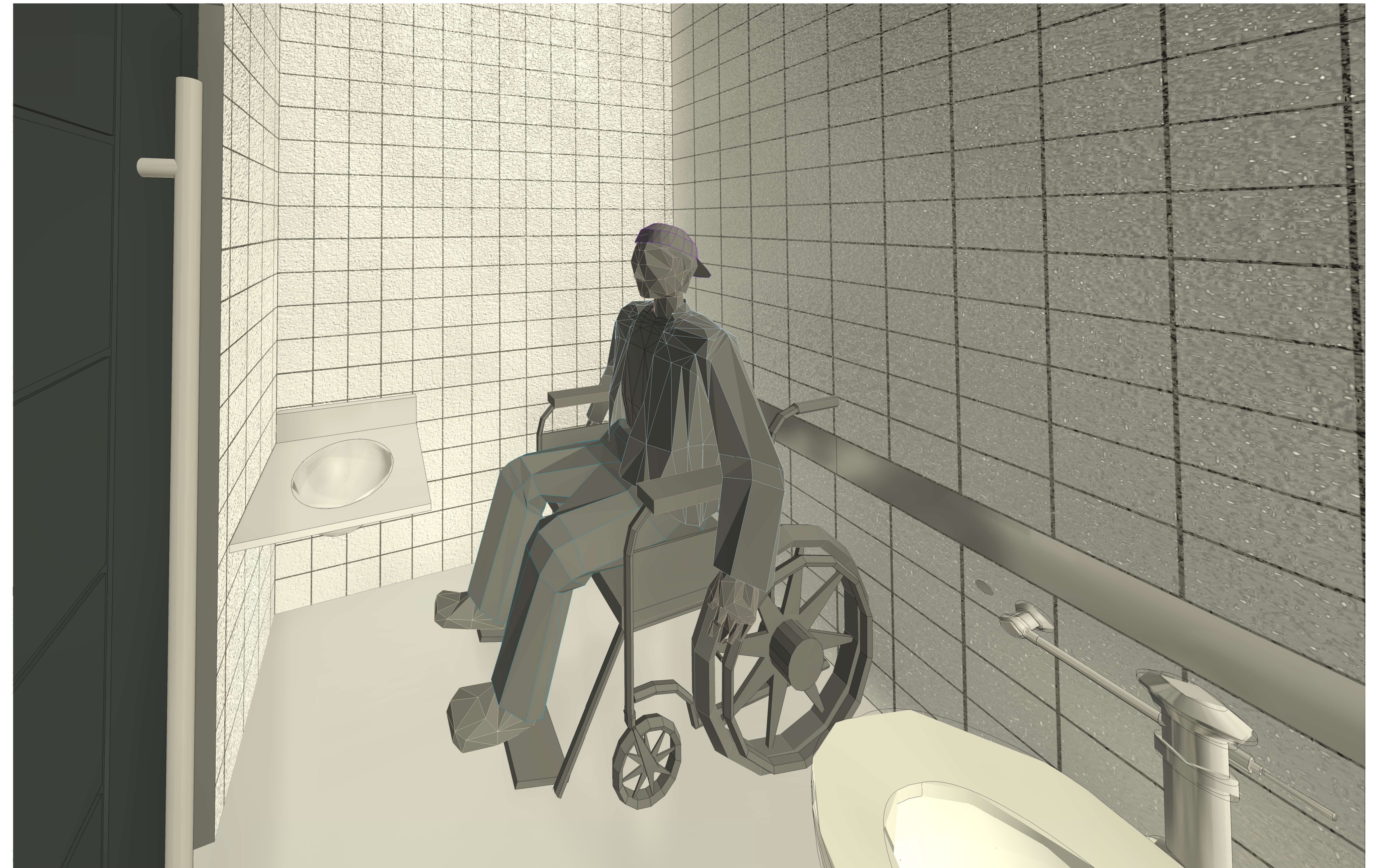
2 Vista 3D - WC