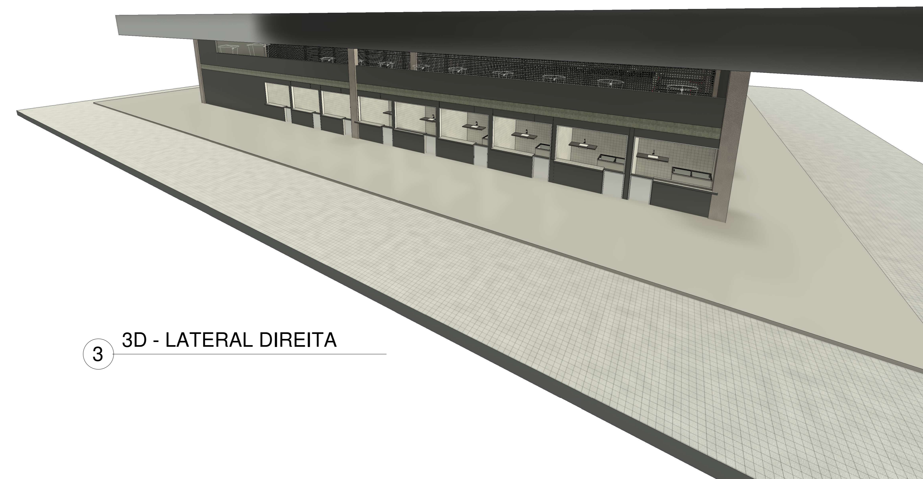
3 3D - LATERAL DIREITA