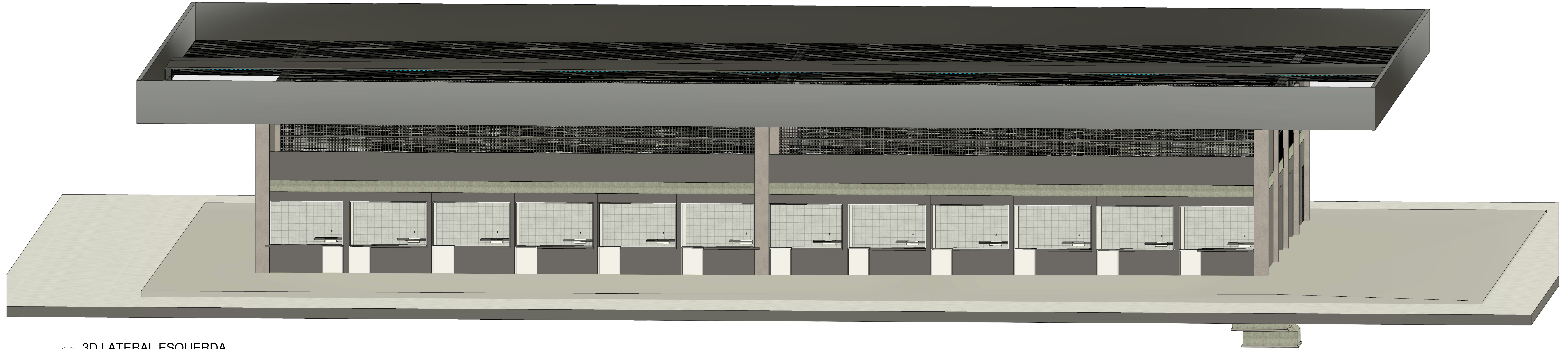
1 3D LATERAL ESQUERDA