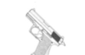
Queda à 30° positivo