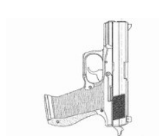
0°Piso de concreto Boca verticalmente para cima.

7.8.6.9.1 Situações em que ocorrerão as quedas: