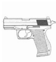
90°Piso de concreto Boca verticalmente para cima.