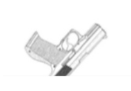
Queda à -30° negativo