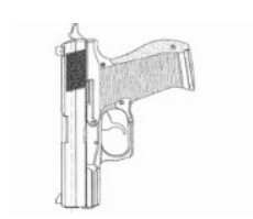
180°Piso de concreto Boca verticalmente para cima.