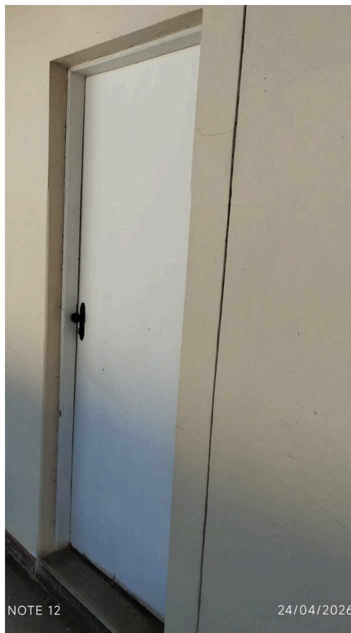
Acima fotos das portas de madeira de serão substituídas por outras de madeira, conforme descrito no item 1.4.3, referente ao Item 01 (Lote 03) - Código do Item 001334409 (foto a esquerda) e Item 02 (Lote 03) - Código do Item 001853627 (foto a direita).