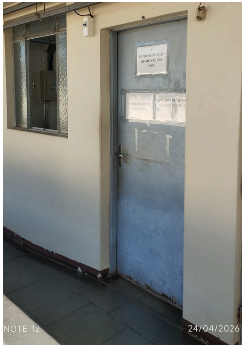
Acima foto da porta de madeira que será substituída pela porta vidro, e receberá os adesivos institucionais.