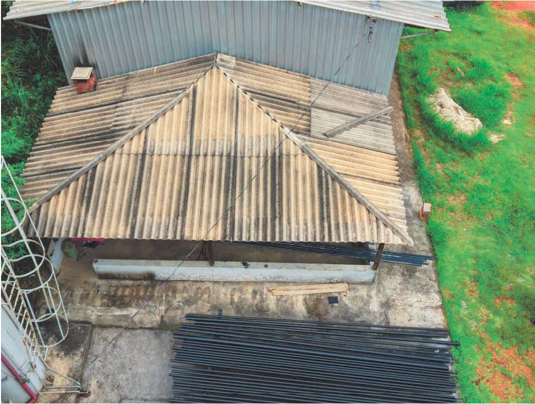
Figura 1 – Vista superior do Quiosque