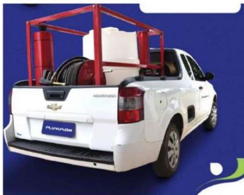
Sistema Bombamax em caçamba - Imagem ilustrativa

A BombaMAX PL40 é um sistema muito mais versátil, leve e fácil de operar se comparado com os caminhões pipa. A BombaMAX possui um dispositivo inovador de aplicação de Líquido Gerador de Espuma (LGE), que garante a proporcionalidade de 3% independente da vazão ou pressão, causando uma expansão de até 20 vezes no volume de líquido. Assim o reservatório de 250 litros pode alcançar um volume de espuma de até 5000 litros. A BombaMAX foi projetada para uma simples e fácil operação. Possui uma embreagem que desacopla a bomba quando o gatilho do jato de espuma é fechado. Assim não há desperdício de fluido entre a mudança de local onde o incêndio está ocorrendo. Devido ao seu tamanho compacto pode ser transportada por uma caminhonete de pequenas dimensões, facilitando o deslocamento até a área de incêndio. O carretel da mangueira, equipado com uma junta rotativa, proporciona fácil operação, possibilitando operar em uma frente de incêndio de até 80 m. (30 m de mangueira + 10m do jato para cada lado).