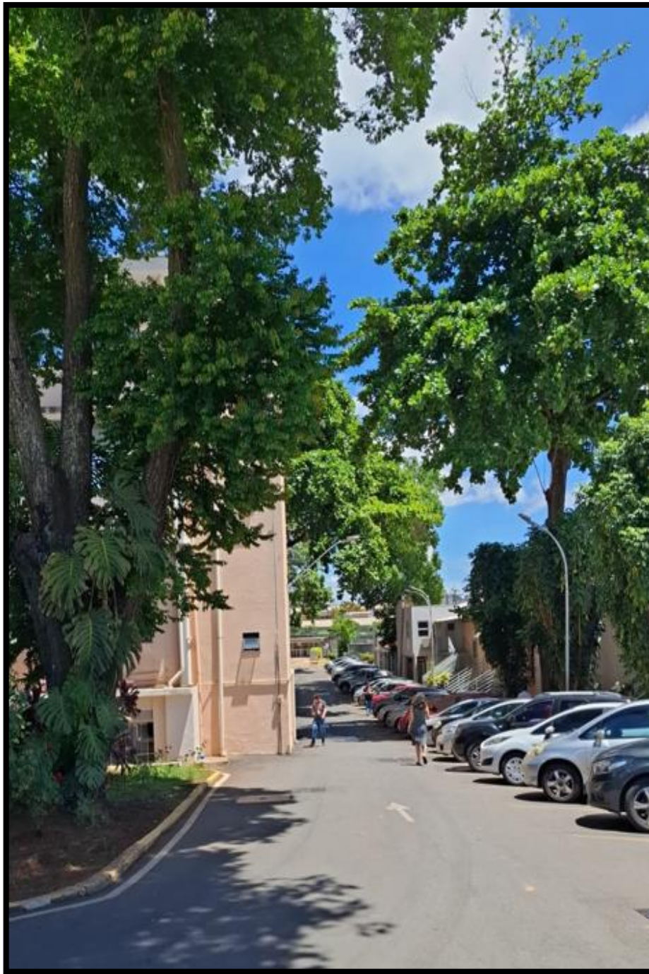
Figura 5: Rua Oswaldo Cruz