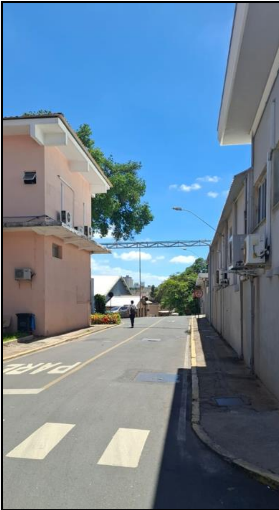
Figura 4: Rua Carlos Ribeiro Diniz