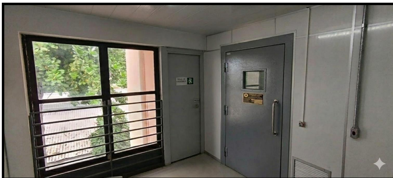
Figura 10: Local do destino final da carga*

*Observação: A figura 9 contida neste documento constitui uma conjectura técnica e ilustrativa das adequações que serão implementadas no local. O objetivo desta representação é demonstrar a viabilidade das alterações físicas — incluindo a remoção de interferências (tubulações) e a ampliação dos vãos de acesso — indispensáveis para a correta instalação e operação dos equipamentos.