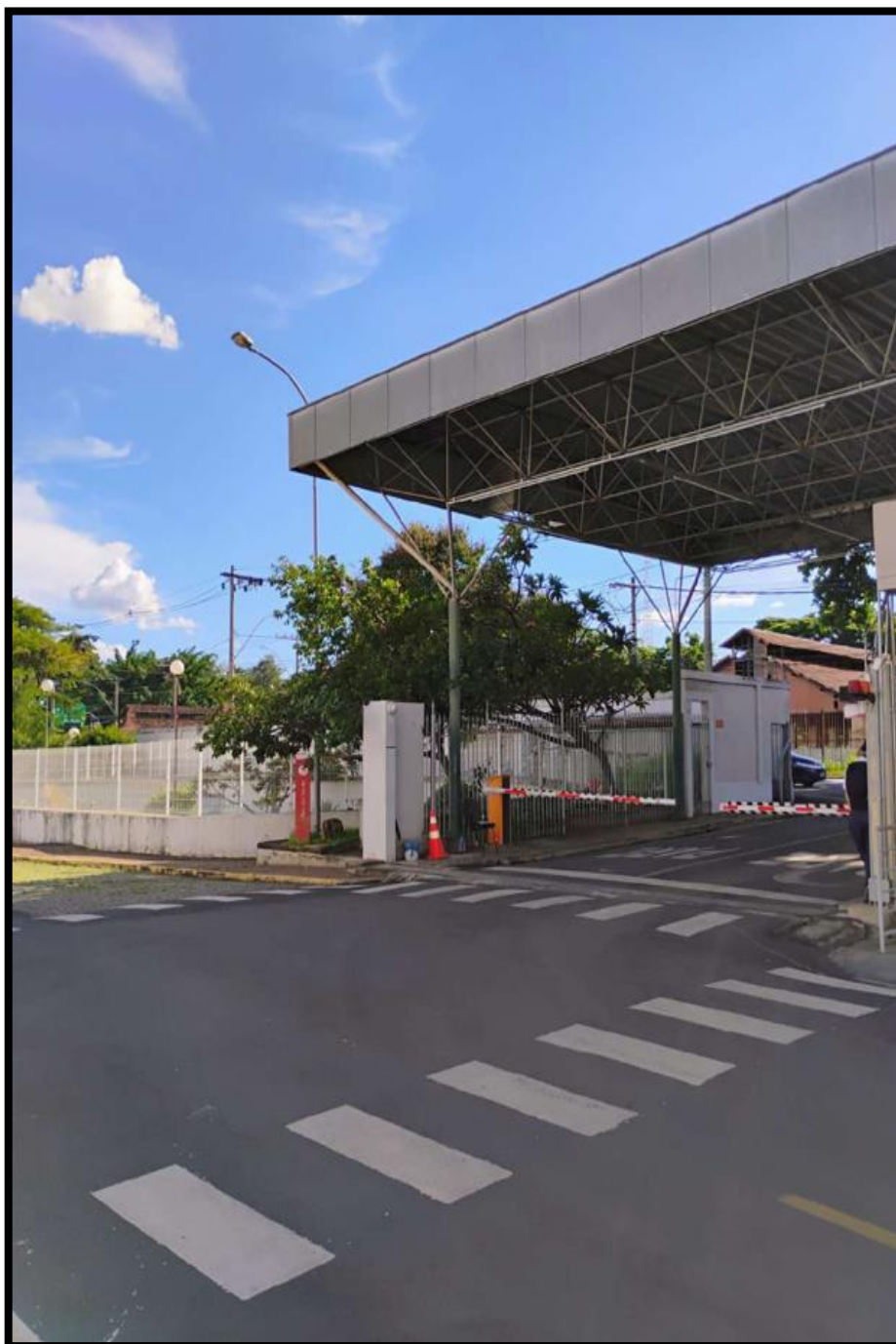
Figura 2:Portaria FUNED