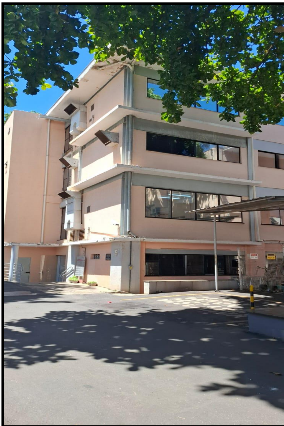
Figura 6: Área de parada