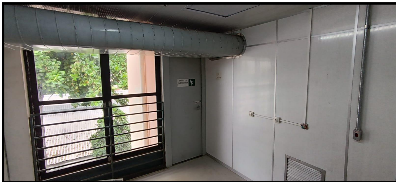
Figura 9: Local atual do destino final da carga