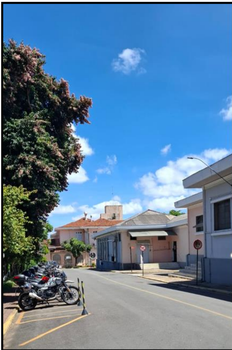
Figura 3: Rua Ezequiel Dias