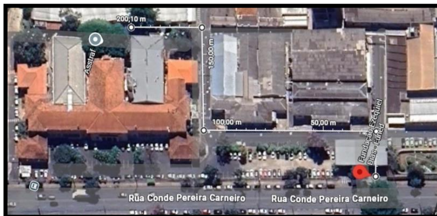
Figura 1: Trajeto interno (transporte e içamento)

A rota será executada conforme o seguinte trajeto: