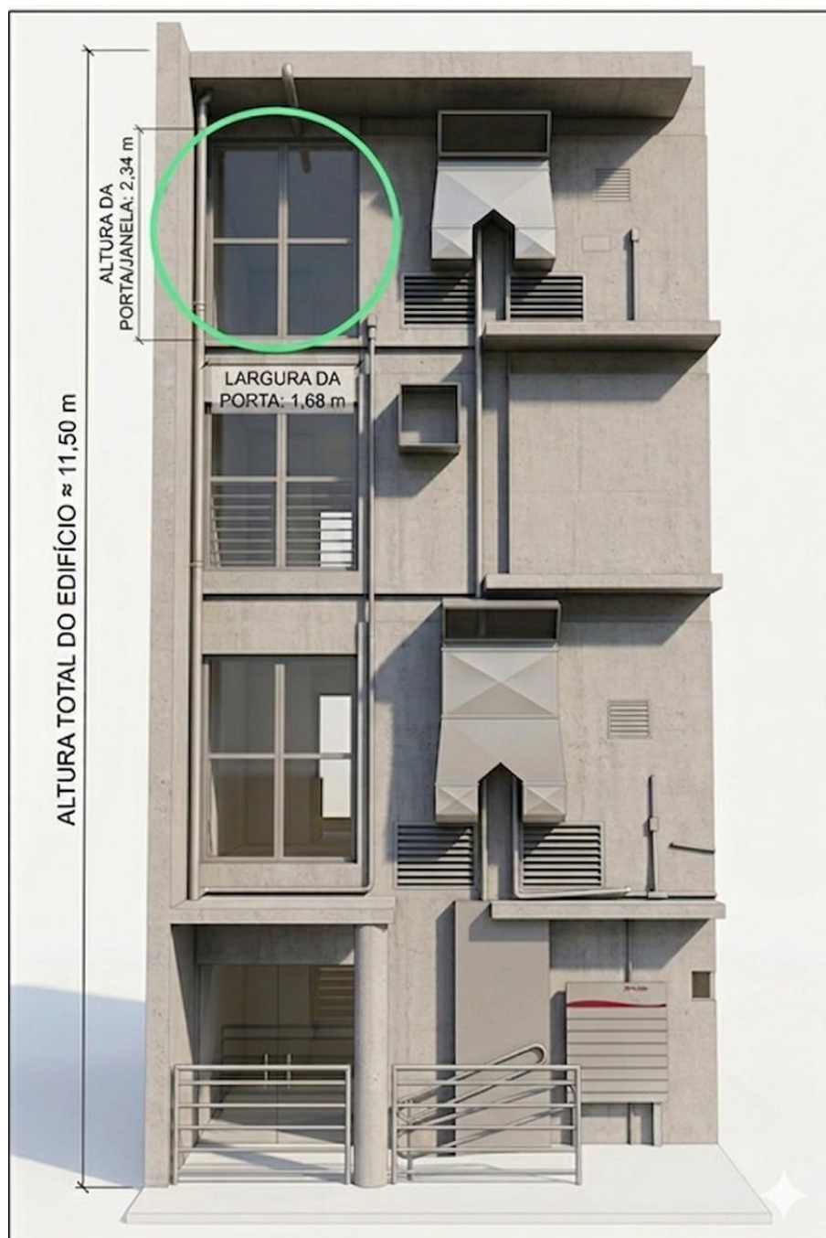
Figura 8: Dimensões aproximadas do prédio DPD