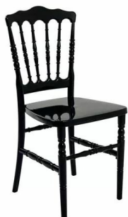
Cadeira modelo Dior, cor preta.

l) medidas aproximadas da almofada: 40cm (largura maior) x 38cm (largura menor) x 4cm (altura) x 44cm (profundidade). Feita sob medida, para melhor adequação das medidas, sendo adquirida em conjunto com a cadeira Dior ;