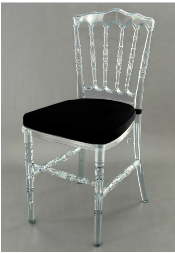
Almofada para assento de cadeira modelo Dior.