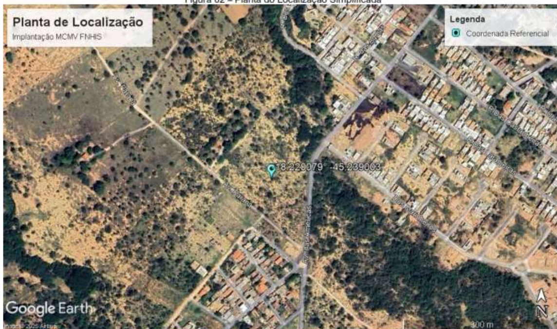
Figura 02 – Planta do Localização Simplificada

PRAÇA CASTELO BRANCO, 03 CENTRO - TEL: (38)3754-8826 - 3754-8802/3754-8803. CEP: 39205-000 - ESTADO DE MINAS GERAIS