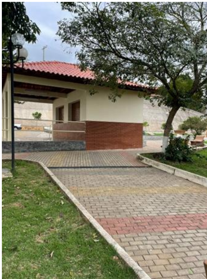
FOTO DA LATERAL DIREITA