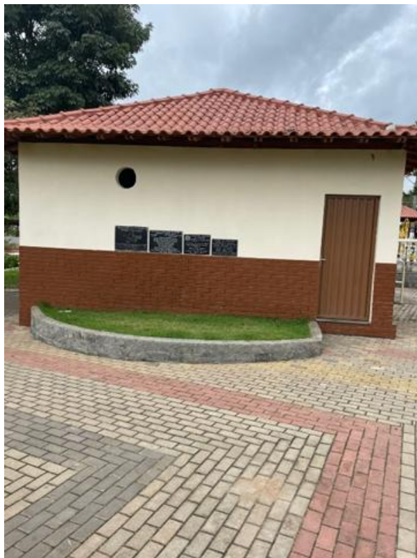
FOTO ÁREA DA PRAÇA