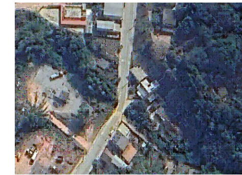
CROQUI DE LOCALIZAÇÃO SEM ESCALA