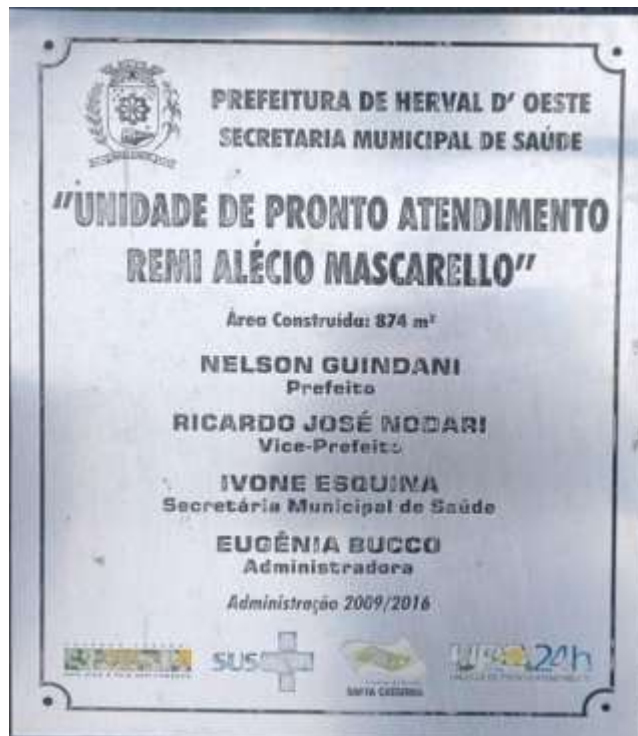
Placa de inauguração da obra