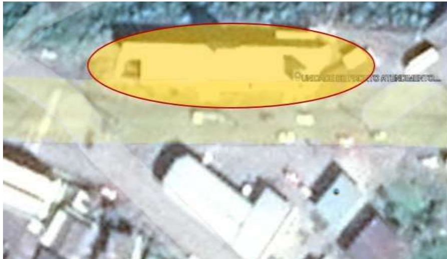
Edificação em agosto/2013