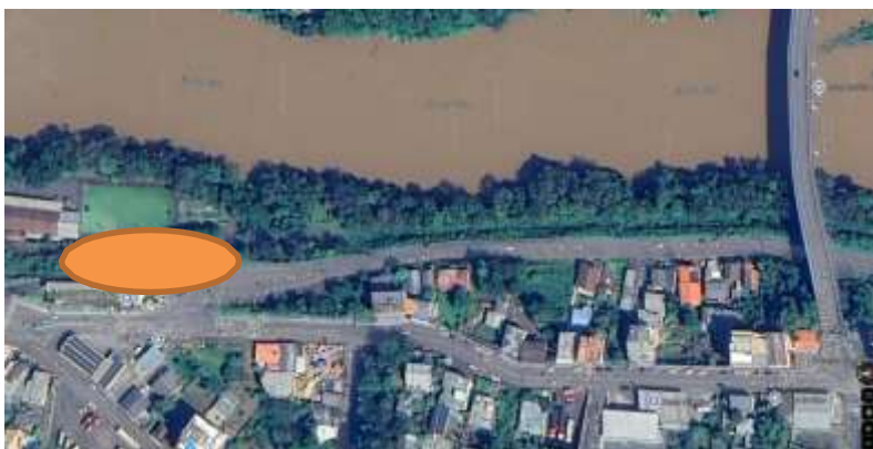
Localização e Situação

O empreendimento faz o uso de gerador de energia a diesel instalado ao lado ou anexo a edificação. A edificação não possui outros riscos especiais.