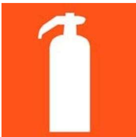
Pictograma indicativo de extintor de incêndio

Art. 19. O abrigo de extintores deve ser sinalizado com o pictograma da figura 1, admitindo-se complementarmente a inscrição "INCÊNDIO".