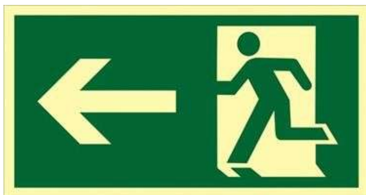
Placa de saída de emergência

§ 1º A sinalização em Santa Catarina, desde 2022, passou a seguir o mesmo padrão adotado pelas NBRs e demais estados do Brasil; as placas deixaram de possuir coloração branca e vermelha, e passaram a ser na coloração verde, conforme exemplo abaixo.