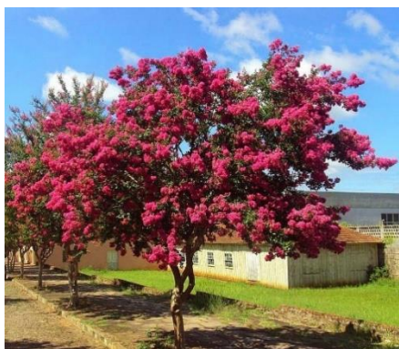
Imagem 04: Resedá (ilustrativa)

Alguns dos canteiros receberão o plantio de árvores, arbustos e flores, conforme demarcado na planta de paisagismo. A muda de Resedá, a muda de Flamboyant e a muda de Pau Fava devem ser plantadas com uma altura de 2m, o Podocarpus com altura de 1m e as demais com altura média de 40cm. O solo deve ser preparado corretamente para o plantio das mudas.