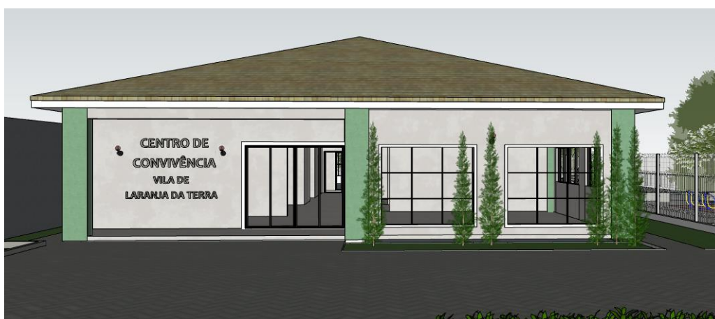
Imagem 13: fachada centro de convivência

A obra será considerada concluída quando todos os serviços estiverem executados, as instalações funcionando. A obra deverá estar completamente limpa em sua conclusão, não apresentando lixo, entulho ou poeira.