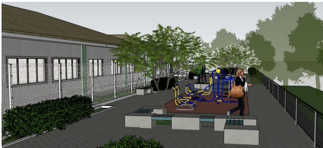
Imagem 13: vista área externa

Laranja da Terra/ES, 16 de janeiro de 2024.