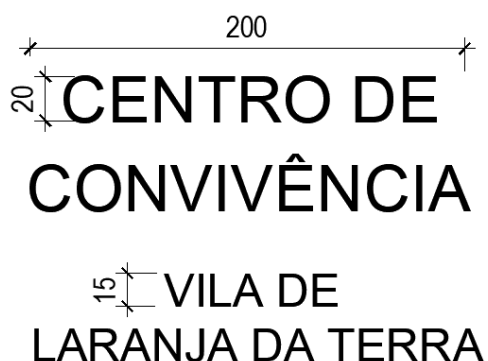
Imagem 12: letreiro em aço inox

Será instalado um letreiro em aço inox na fachada, conforme imagem abaixo.