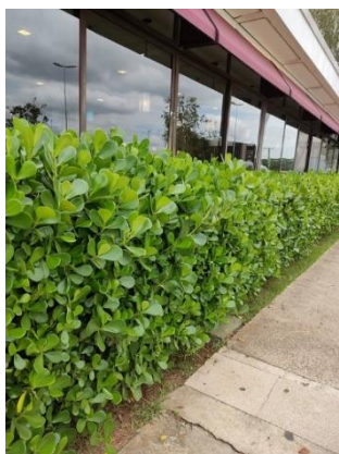
Imagem 08: Clúsia (ilustrativa)