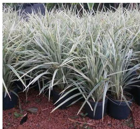
Imagem 09: Barba de serpente (ilustrativa)