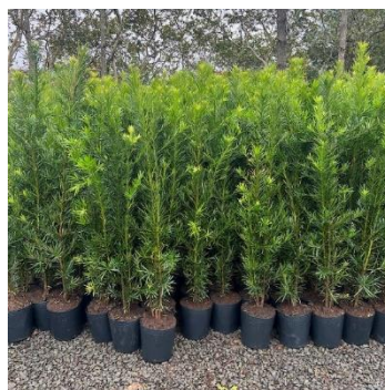
Imagem 07: Podocarpus (ilustrativa)