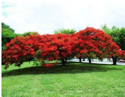
Imagem 05: Flamboyant (ilustrativa)