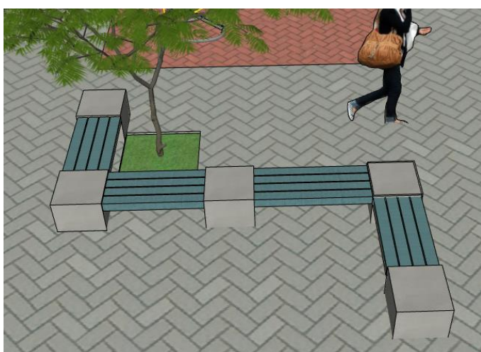
Imagem 02: banco de concreto a serem executados

Serão executados na parte externa bancos de concreto, e devem ser executados conforme detalhamento em projeto, e que receberão ao final da execução pintura em três demãos com tinta específica para concreto.