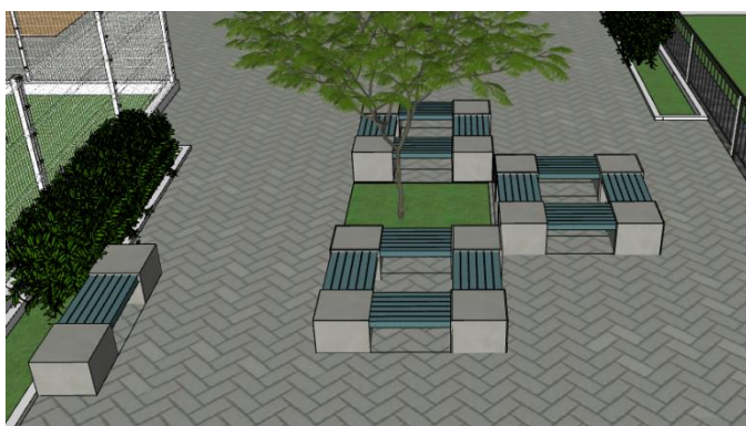
Imagem 03: banco de concreto a serem executados