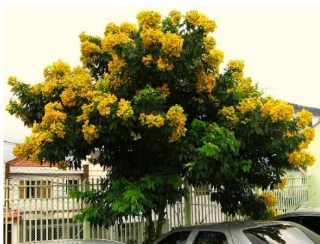
Imagem 06: Pau fava (ilustrativa)