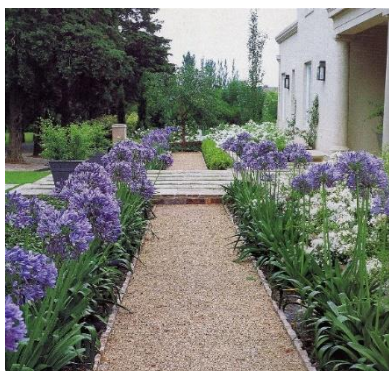
Imagem 10: Agapanto (ilustrativa)