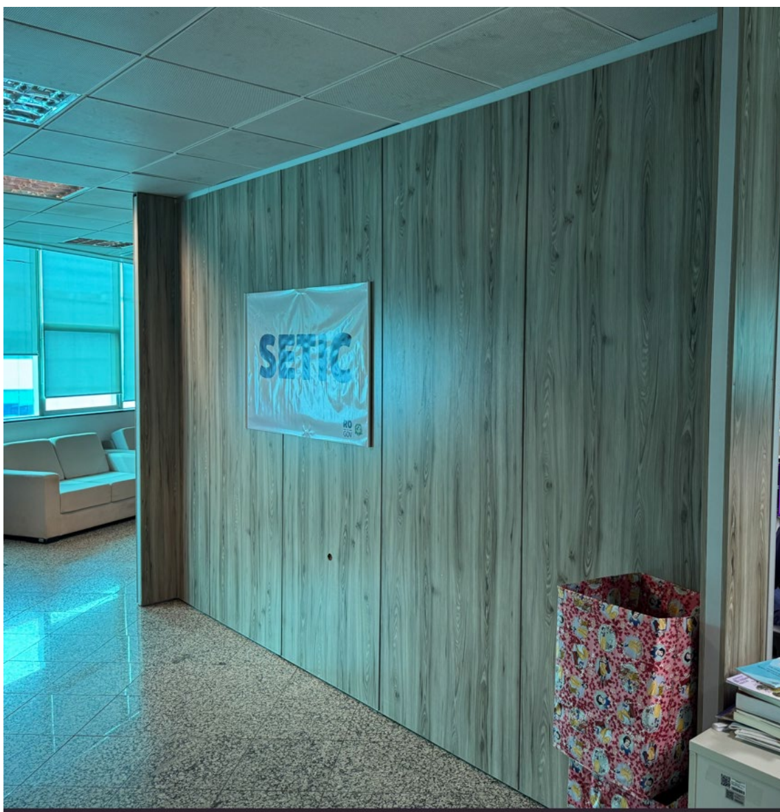
Vista do local de instalação do móvel.