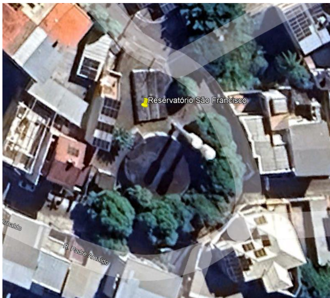
Figura 1: Local do Reservatório.