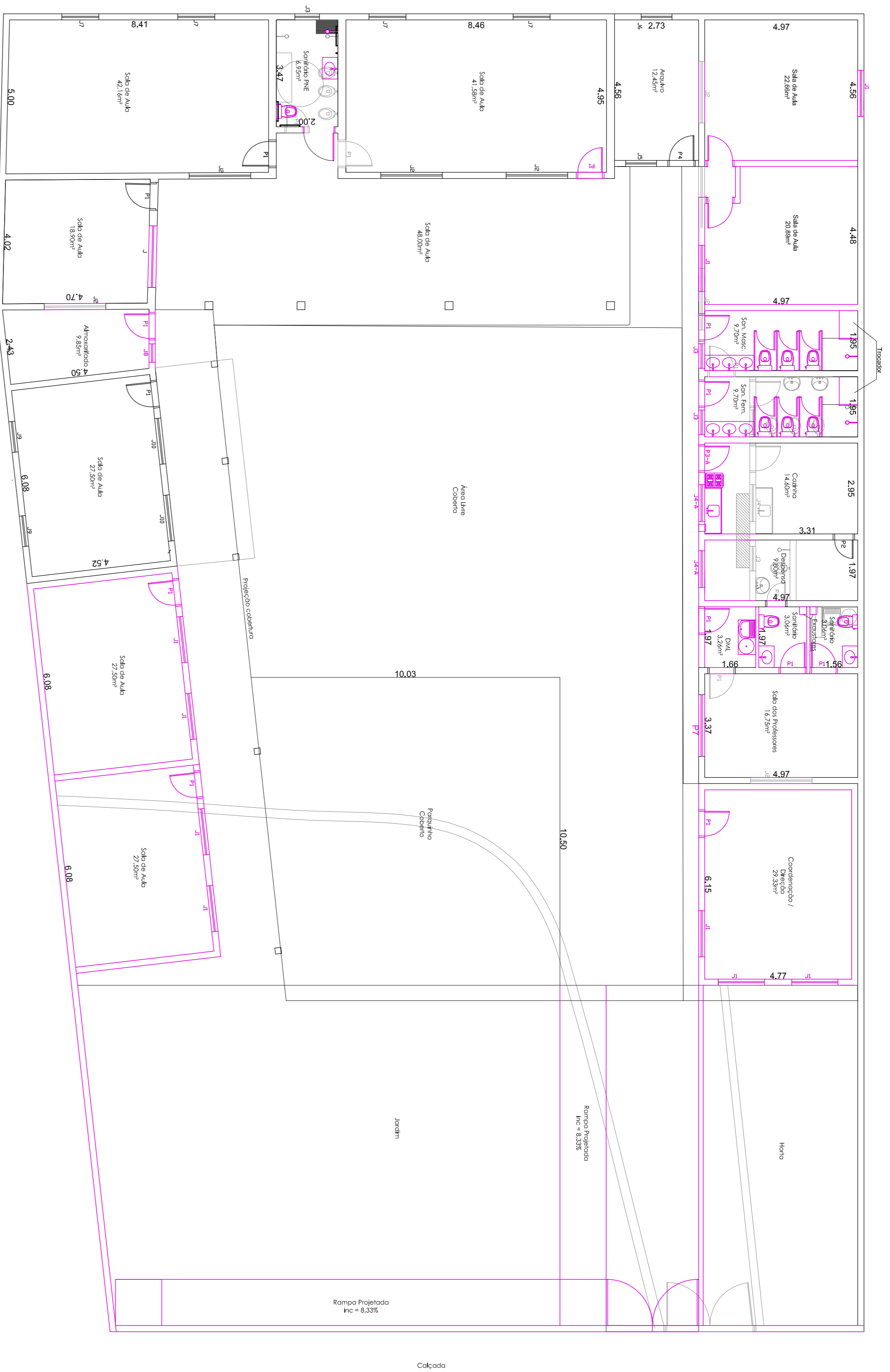
PLANTA BAIXA esc: 1:100