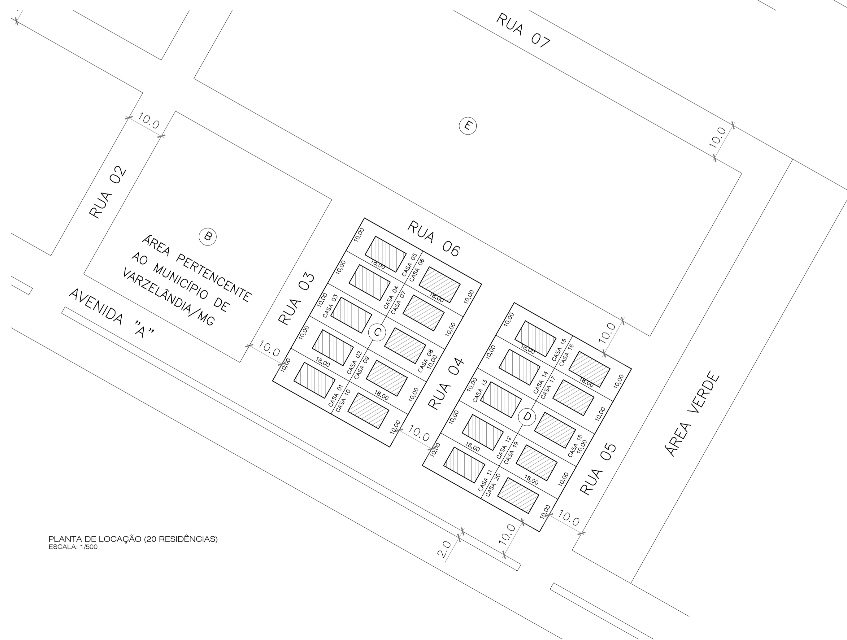
PLANTA DE LOCAÇÃO (20 RESIDÊNCIAS) ESCALA: 1/500