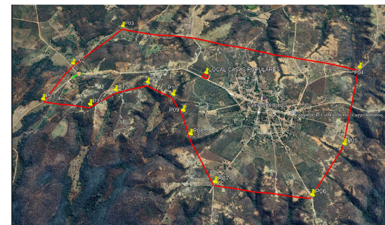
2 IMAGEM DE SATÉLITE – GOOGLE EARTH SEM ESCALA