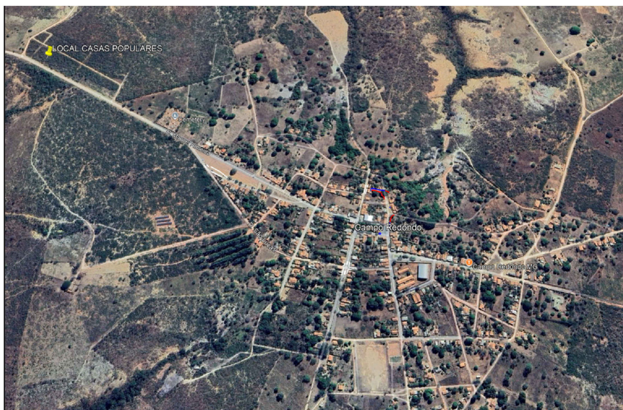
IMAGEM SATÉLITE - LOCALIZAÇÃO SEM ESCALA