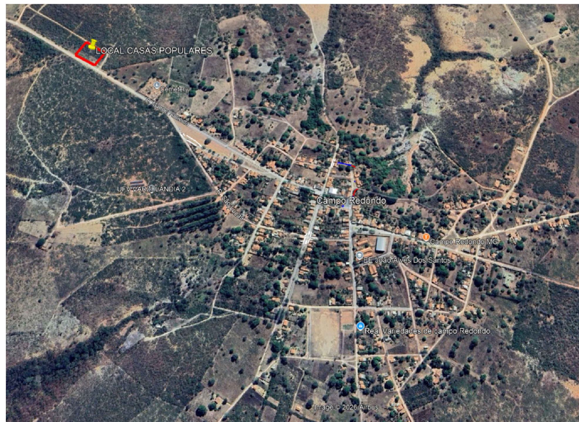
IMAGEM SATÉLITE - LOCALIZAÇÃO SEM ESCALA