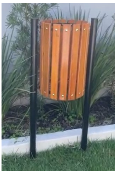
Imagem de referência para lixeira

Devem ser fornecidas instaladas lixeiras de estrutura metálica e réguas em madeira, semelhantes às existentes na “Praça Sagrados Corações”, completas, inclusive pintura.