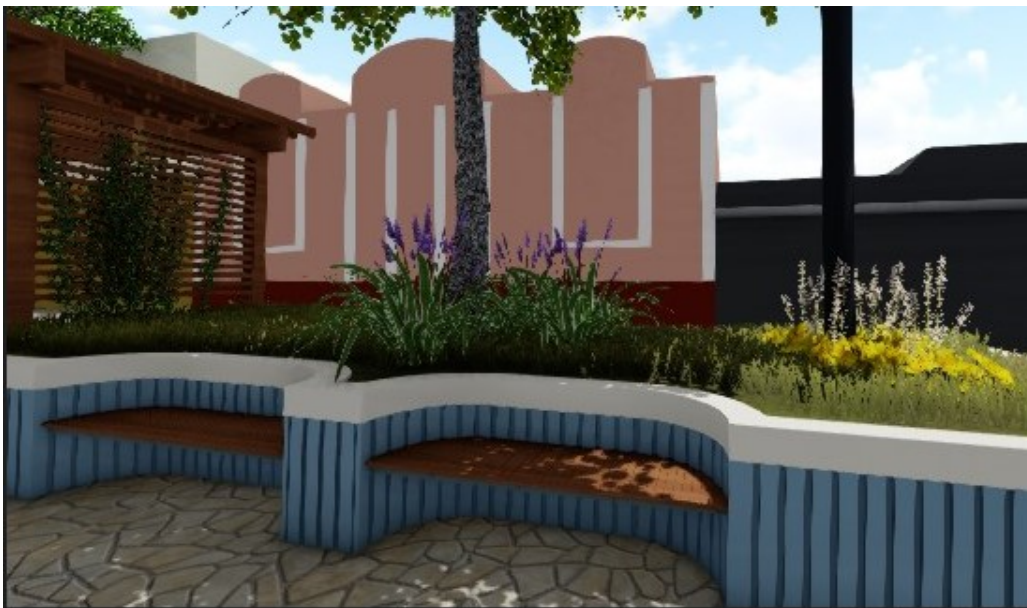
ilustração de canteiro tipo "alto" com banco de assento em madeira

Toda a madeira deverá receber lixamento prévio e aplicação de duas demãos de verniz sintético marítimo com acabamento acetinado, garantindo proteção contra intempéries