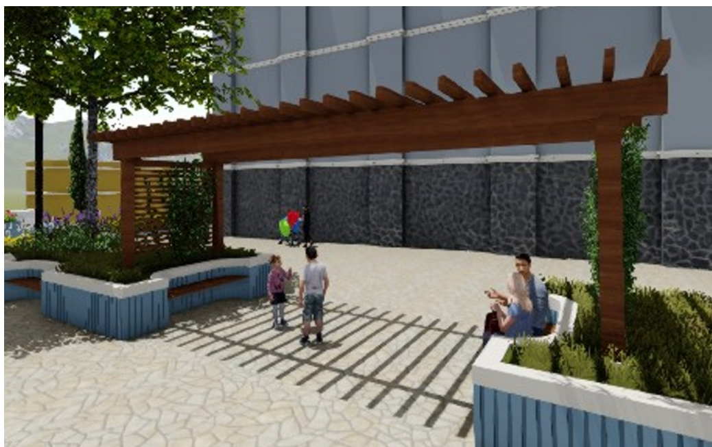
ilustração de pergolado em madeira

Todas as peças devem ser aparelhadas e envernizadas com verniz marítimo em duas demãos.