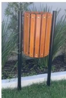
Imagem de referência para lixeira

Devem ser fornecidas instaladas lixeiras de estrutura metálica e réguas em madeira, semelhantes às já existentes, completas, inclusive pintura.