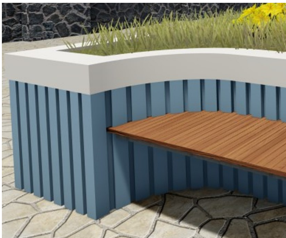
ilustração do acabamento em argamassa dos canteiros tipo "alto"