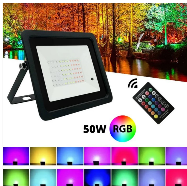
Imagem de referência refletor RGB

Devem ser instalados refletores LED RGB (com mudança de cores), IP65, à prova d'água, de 50W, conforme projeto.