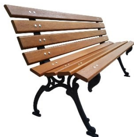
Imagem de referência para banco

Devem ser fornecidos e instalados bancos em pé de ferro tipo “tamanduá” e réguas em madeira, com 1,50m de comprimento, completo, inclusive pintura.