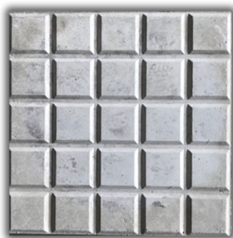
Imagem de referência para o ladrilho tipo “dado”

Os pisos da cruz, escadas e patamar da igreja serão em ladrilho hidráulico 20x20cm, padrão “dados”, com natural, assentado com argamassa colante sobre contrapiso em argamassa com espessura média de 5cm.