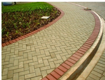
Imagens de referência para pavimento intertravado de concreto colorido