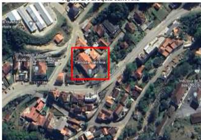
Figura 1. Paróquia Sant'Ana

A Paróquia Sant'Ana está localizada no bairro Centro, no município de Wenceslau Braz, Minas Gerais