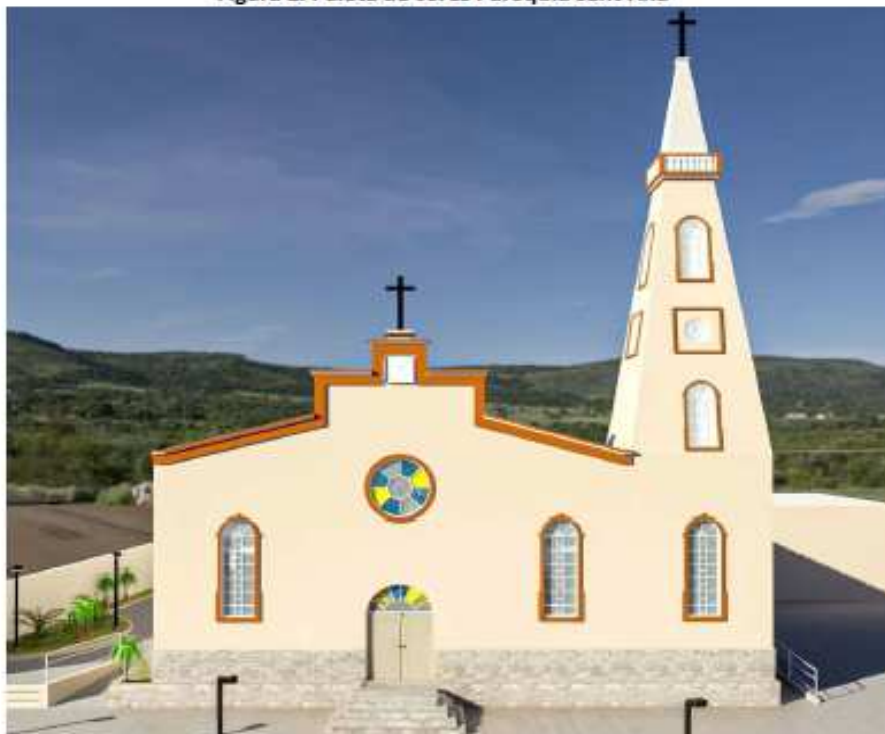
Figura 2. Paleta de cores Paróquia Sant'Ana

As paredes deverão receber preparo com uma demão de selador acrílico, e posteriormente deverão receber três demãos de pintura acrílica. A pintura deverá seguir a paleta de cores conforme a ilustração seguinte: