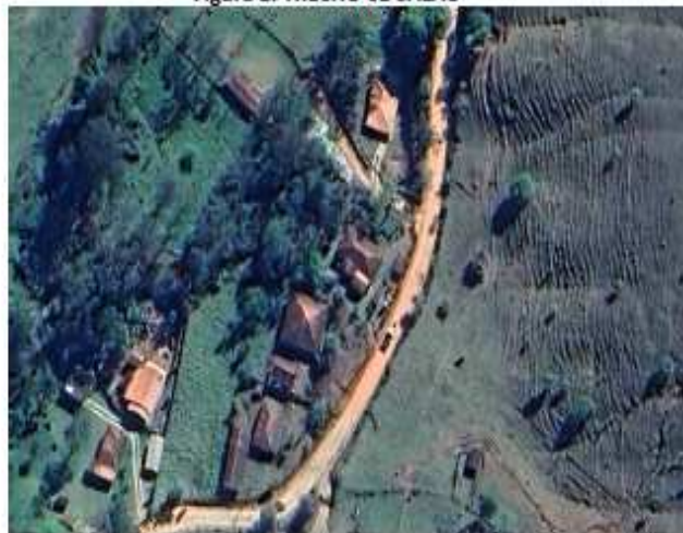
Figura 1. TRECHO 01 SALÃO

Os serviços devem seguir rigorosamente todo processo deste memorial e o projeto de cada uma das áreas. Toda e qualquer alteração ou adição de serviço deverá ser solicitada antes ao engenheiro responsável pela fiscalização da obra, para que posteriormente haja vistoria para analisar a necessidade da mesma.