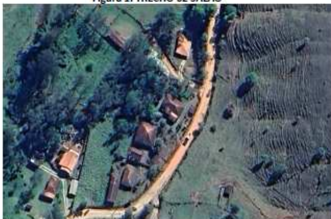
Figura 1. TRECHO 02 SALÃO

Os serviços devem seguir rigorosamente todo processo deste memorial e o projeto de cada uma das áreas. Toda e qualquer alteração ou adição de serviço deverá ser solicitada antes ao engenheiro responsável pela fiscalização da obra, para que posteriormente haja vistoria para analisar a necessidade da mesma.