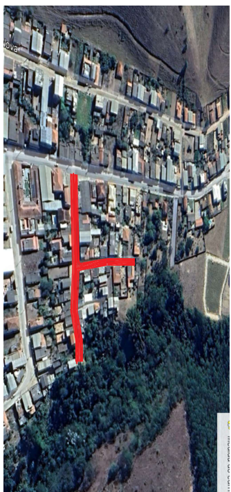
CROQUI DE LOCALIZAÇÃO Travessa Manoel de Freitas ESCALA 1:1500