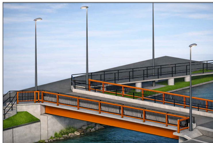
③ IMAGEM LAYOUT GERAL