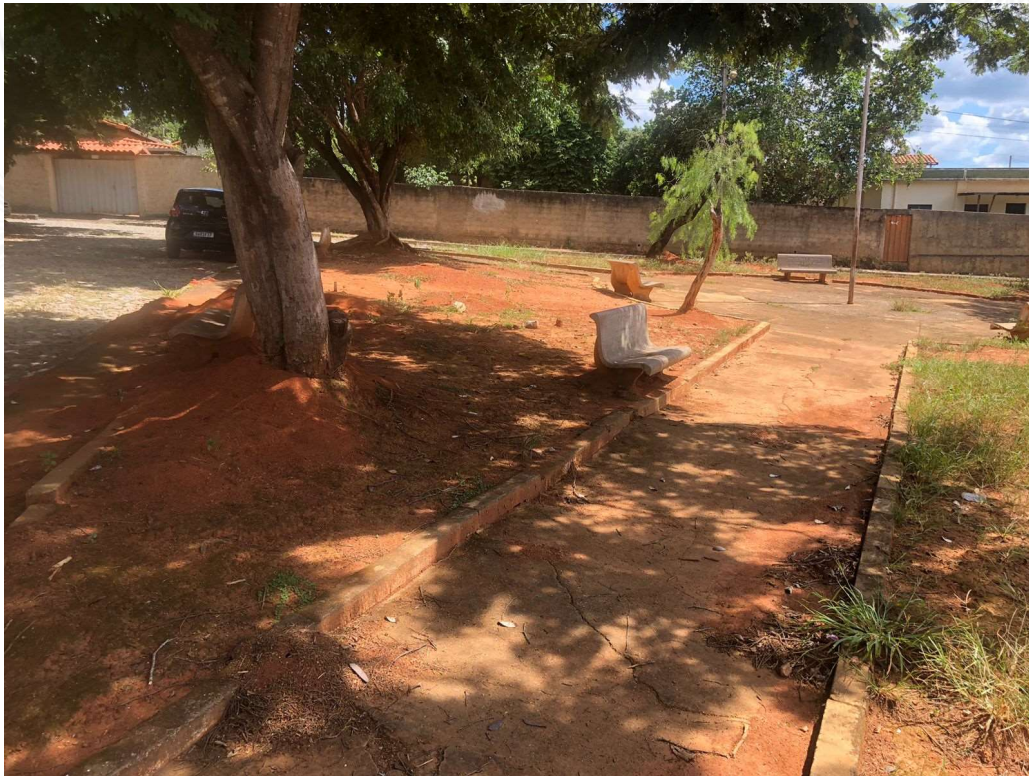
Foto 6: Praça Pedro Sabino, Sede do Município de Baldim-MG.