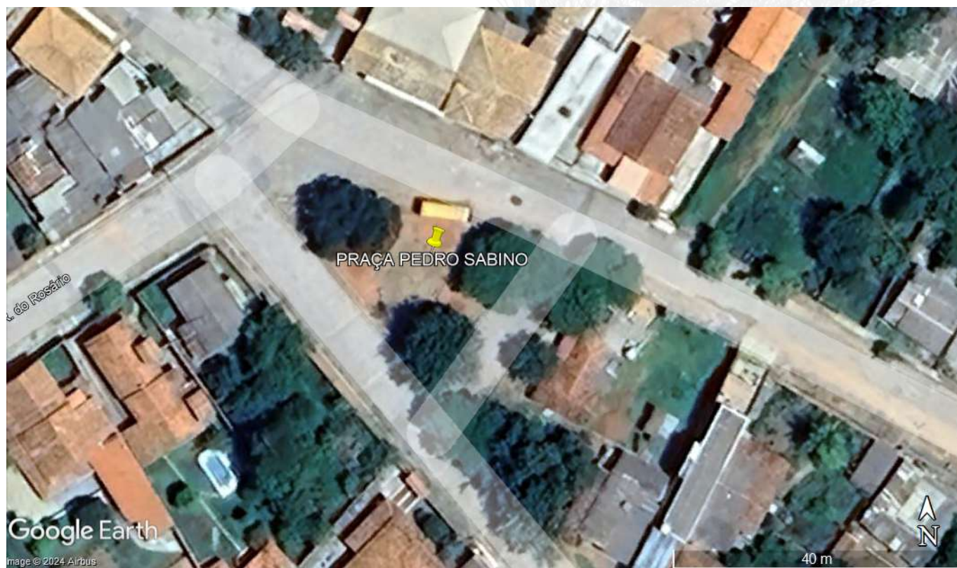
Foto 1: Praça Pedro Sabino, sede do Município de Baldim-MG. Coordenadas Geográficas do Ponto LATITUDE: -19.288139°; LONGITUDE: -43.951442°.