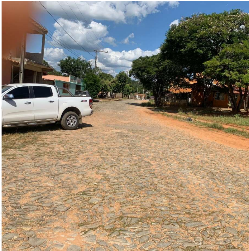
Foto 11: Praça Pedro Sabino, Sede do Município de Baldim-MG.