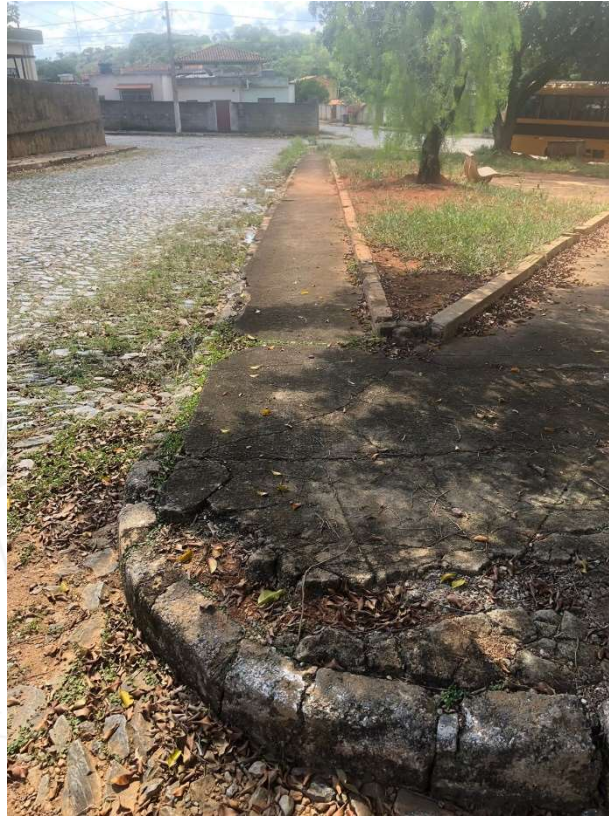
Foto 5: Praça Pedro Sabino, Sede do Município de Baldim-MG.