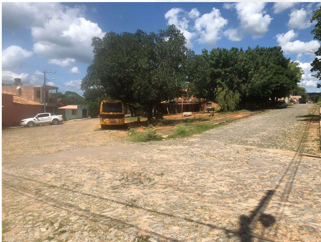
Foto 10: Praça Pedro Sabino, Sede do Município de Baldim-MG.