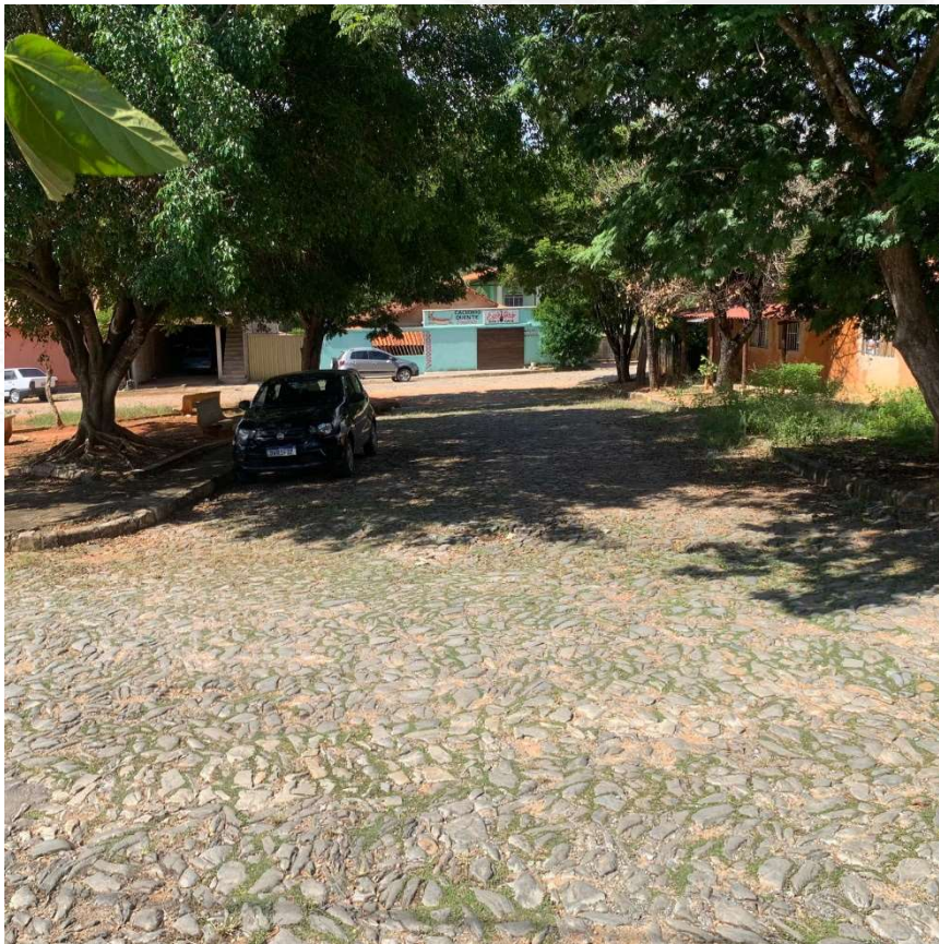
Foto 12: Praça Pedro Sabino, Sede do Município de Baldim-MG.