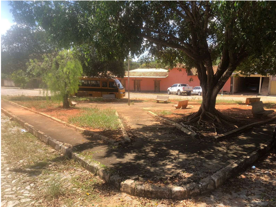
Foto 1: Praça Pedro Sabino, Sede do Município de Baldim-MG.