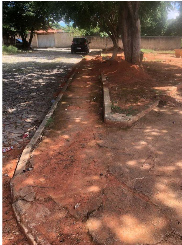
Foto 7: Praça Pedro Sabino, Sede do Município de Baldim-MG.