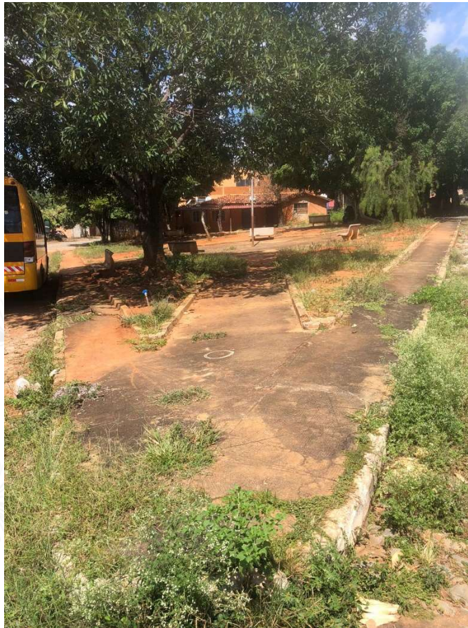
Foto 3: Praça Pedro Sabino, Sede do Município de Baldim-MG.