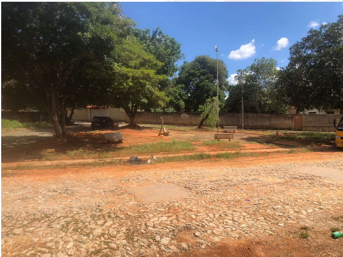
Foto 8: Praça Pedro Sabino, Sede do Município de Baldim-MG.