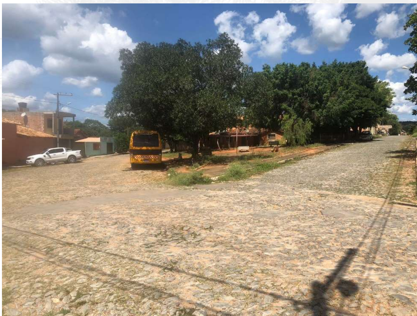
Foto 2: Praça Pedro Sabino, Sede do Município de Baldim-MG.