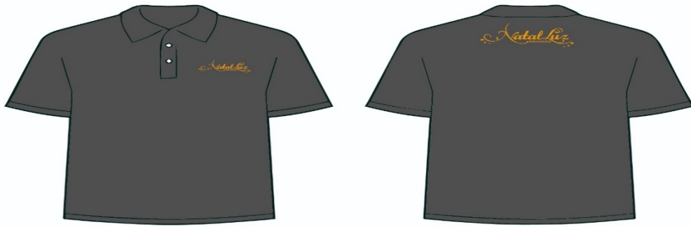
Anexo nº4: Imagem meramente ilustrativa