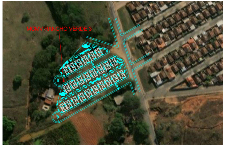
○ Cruzal de Localização Esc.: 1/ESCALA