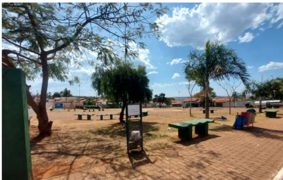
Descrição: Localização Avenida Josefina Ferreira dos Santos

Secretaria de Estado de Transportes e Obras Públicas – SETOP/MG Internet: www.transportes.mg.gov.br / E-mail: dpc@transportes.mg.gov.br Telefones: (31) 3915-8370 – 3915-8374