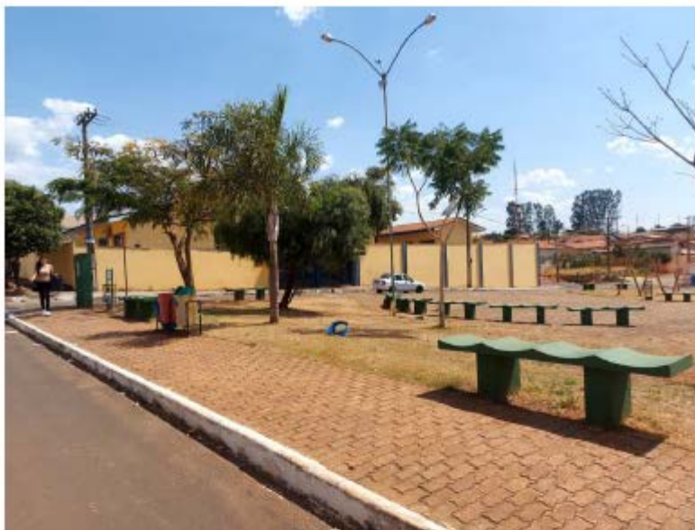
Descrição: Localização Av. Josefina Ferreira dos Santos; Mobiliários existentes

E-mail: licitacao@pedrinopolis.mg.gov.br - Site: www.pedrinopolis.mg.gov.br