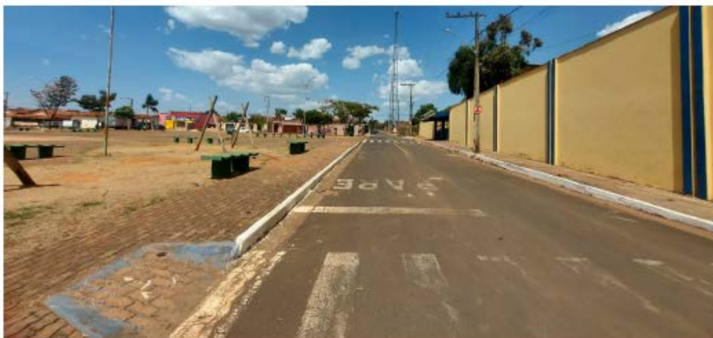
Descrição: Localização Rua Ananias Rodrigues da Costa

E-mail: licitacao@pedrinopolis.mg.gov.br - Site: www.pedrinopolis.mg.gov.br