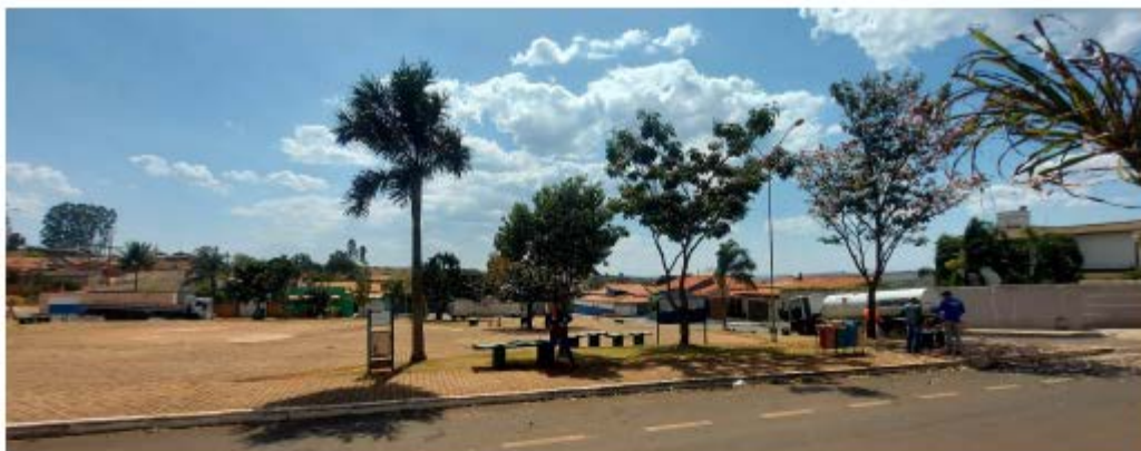
Descrição: Localização Av. Josefina Ferreira dos Santos

E-mail: licitacao@pedrinopolis.mg.gov.br - Site: www.pedrinopolis.mg.gov.br