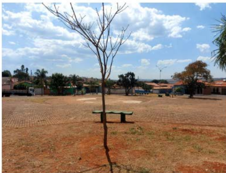
Descrição: Localização Av. Josefina Ferreira dos Santos; Mobiliários existentes

E-mail: licitacao@pedrinopolis.mg.gov.br - Site: www.pedrinopolis.mg.gov.br