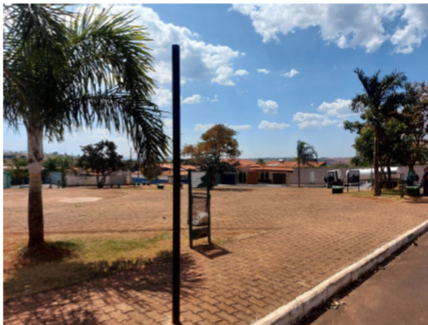
Descrição: Localização Avenida Josefina Ferreira dos Santos

E-mail: licitacao@pedrinopolis.mg.gov.br - Site: www.pedrinopolis.mg.gov.br