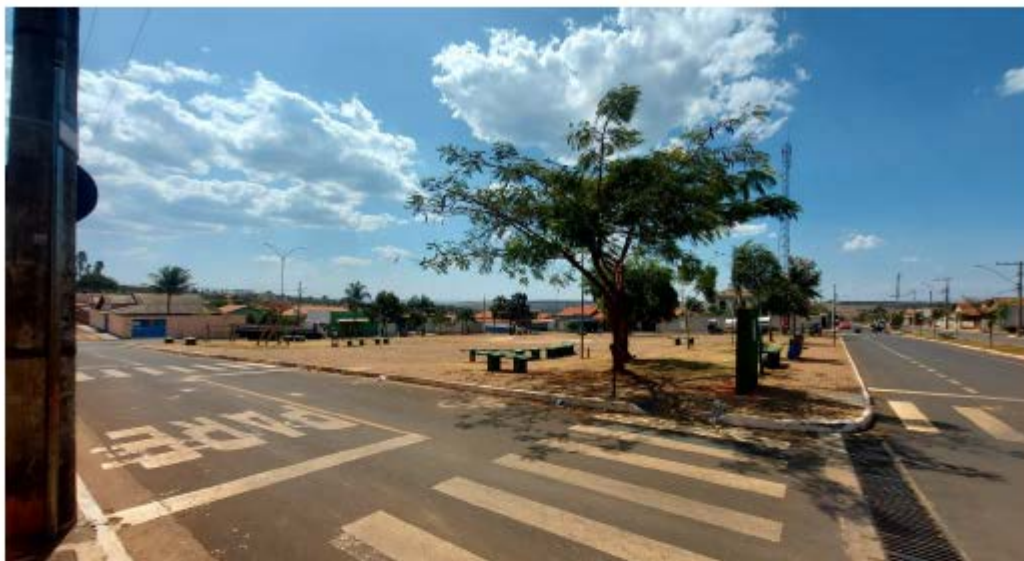
Descrição: Esquina das Ruas Ananias Rodrigues da Costa e Avenida Josefina Ferreira dos Santos

E-mail: licitacao@pedrinopolis.mg.gov.br - Site: www.pedrinopolis.mg.gov.br