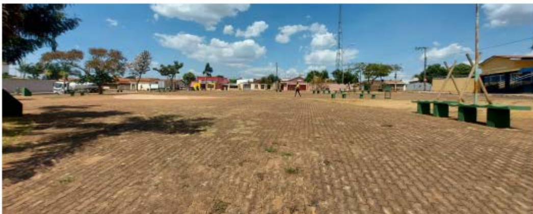
Descrição: Localização área central da praça

E-mail: licitacao@pedrinopolis.mg.gov.br - Site: www.pedrinopolis.mg.gov.br