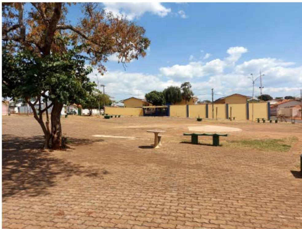
Descrição: Localização Área central da praça ; Mobiliários existentes

Secretaria de Estado de Transportes e Obras Públicas – SETOP/MG Internet: www.transportes.mg.gov.br / E-mail: dpc@transportes.mg.gov.br Telefones: (31) 3915-8370 – 3915-8374