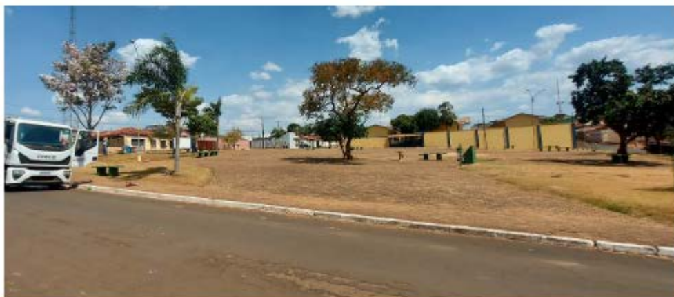
Descrição: Localização Rua Ariosvaldo Gomes Ferreira

Secretaria de Estado de Transportes e Obras Públicas – SETOP/MG Internet: www.transportes.mg.gov.br / E-mail: dpo@transportes.mg.gov.br Telefones: (31) 3915-8370 – 3915-8374