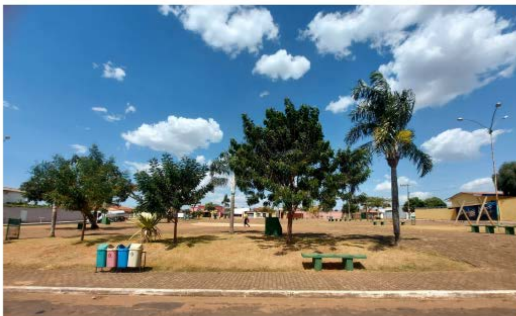
Descrição: Localização Vital Epifane

Secretaria de Estado de Transportes e Obras Públicas – SETOP/MG Internet: www.transportes.mg.gov.br / E-mail: dpo@transportes.mg.gov.br Telefones: (31) 3915-8370 – 3915-8374