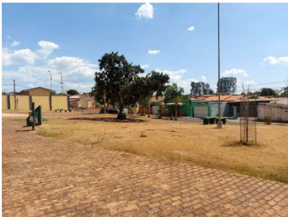
Descrição: Localização Área central da praça ; Mobiliários existentes

E-mail: licitacao@pedrinopolis.mg.gov.br - Site: www.pedrinopolis.mg.gov.br