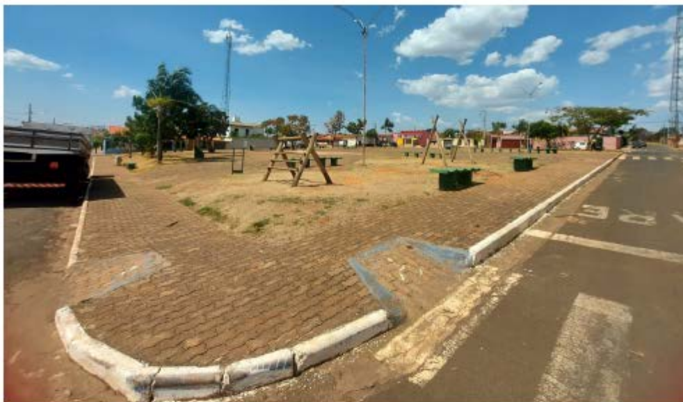
Descrição: Localização Esquina das ruas Vital Epifane com a Rua Ananias Rodrigues da Costa; Área do atual playground e mobiliários existentes

E-mail: licitacao@pedrinopolis.mg.gov.br - Site: www.pedrinopolis.mg.gov.br