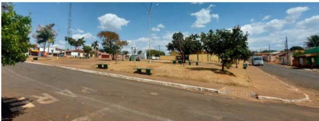
Descrição: Localização Rua Ariosvaldo Gomes Ferreira

E-mail: licitacao@pedrinopolis.mg.gov.br - Site: www.pedrinopolis.mg.gov.br