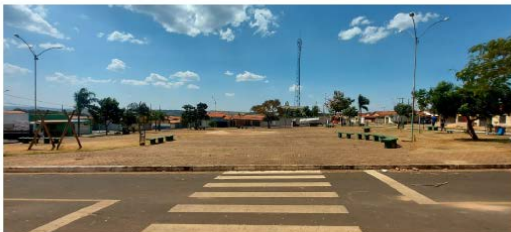
Descrição: Localização Rua Ananias Rodrigues da Costa

Secretaria de Estado de Transportes e Obras Públicas – SETOP/MG Internet: www.transportes.mg.gov.br / E-mail: dpc@transportes.mg.gov.br Telefones: (31) 3915-8370 – 3915-8374