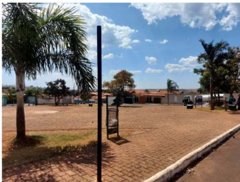
Descrição: Localização Av. Josefina Ferreira dos Santos; Mobiliários existentes

Secretaria de Estado de Transportes e Obras Públicas – SETOP/MG Internet: www.transportes.mg.gov.br / E-mail: dpo@transportes.mg.gov.br Telefones: (31) 3915-8370 – 3915-8374