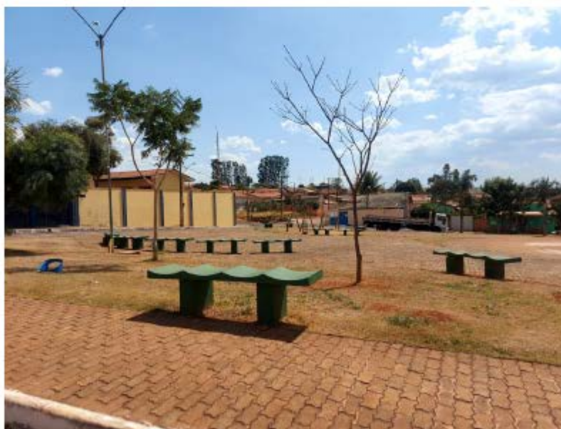
Descrição: Localização Av. Josefina Ferreira dos Santos; Mobiliários existentes

Secretaria de Estado de Transportes e Obras Públicas – SETOP/MG Internet: www.transportes.mg.gov.br / E-mail: dpc@transportes.mg.gov.br Telefones: (31) 3915-8370 – 3915-8374