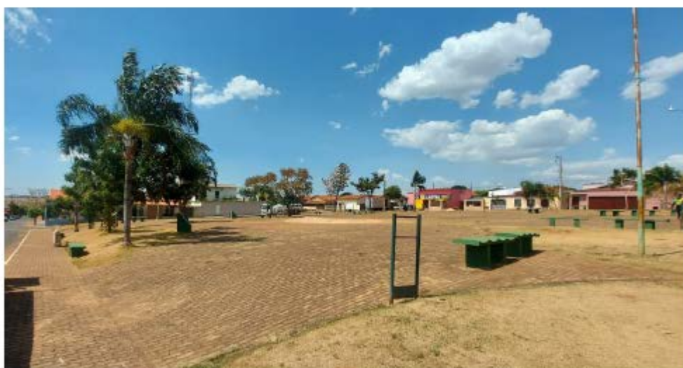
Descrição: Área do atual playground e mobiliários existentes

Secretaria de Estado de Transportes e Obras Públicas – SETOP/MG Internet: www.transportes.mg.gov.br / E-mail: dpo@transportes.mg.gov.br Telefones: (31) 3915-8370 – 3915-8374