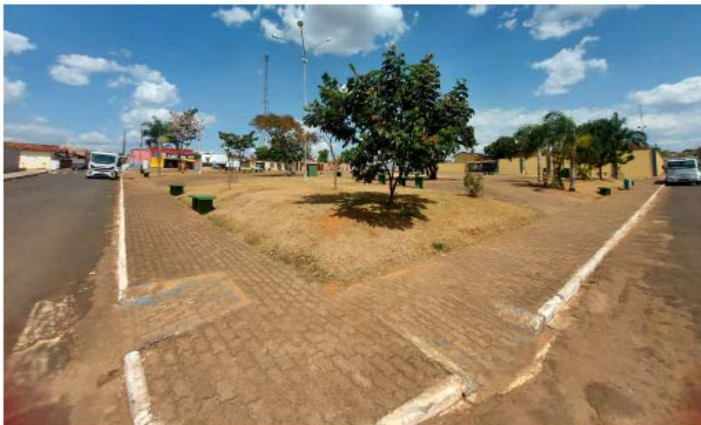
Descrição: Localização Esquina das Ruas Ariosvaldo Gomes Ferreira com a Rua Vital Epifane

Secretaria de Estado de Transportes e Obras Públicas – SETOP/MG Internet: www.transportes.mg.gov.br / E-mail: dpc@transportes.mg.gov.br Telefones: (31) 3915-8370 – 3915-8374