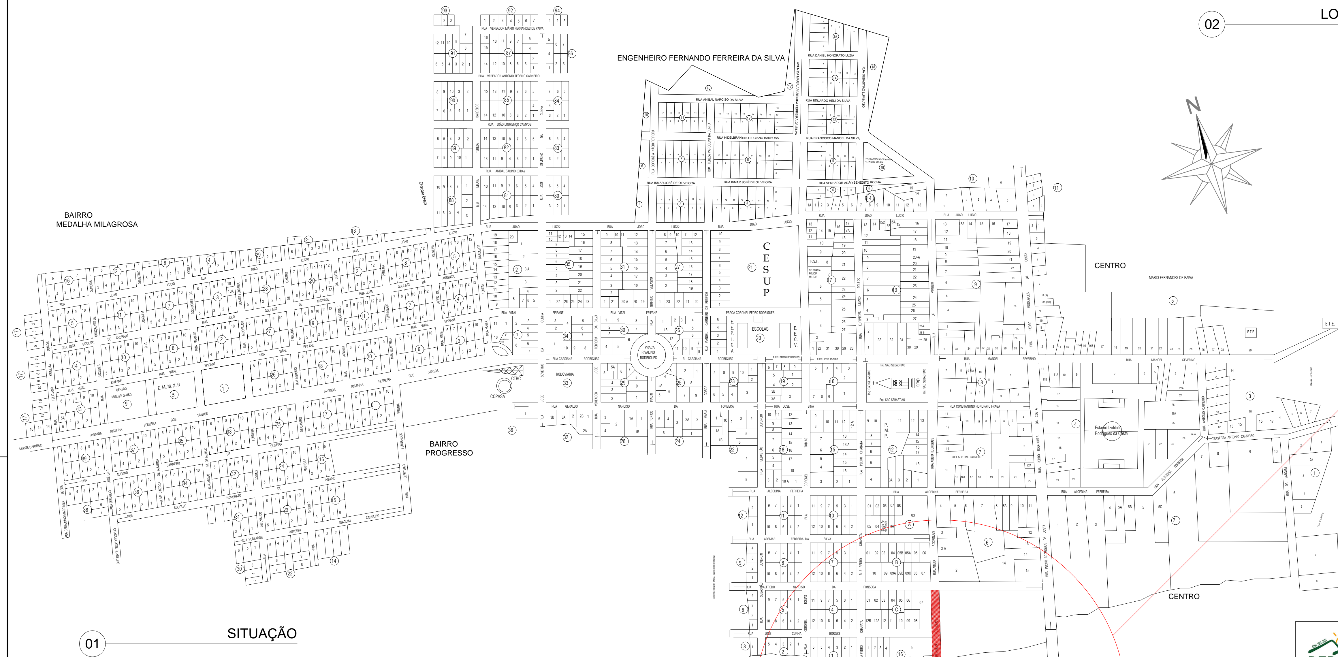
02 LOCALIZAÇÃO Escala: 1:1500