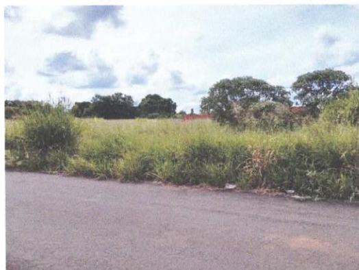
Vista do Imóvel Avaliando

Finalidade do Parecer: Determinação do Valor Mercadológico de VENDA