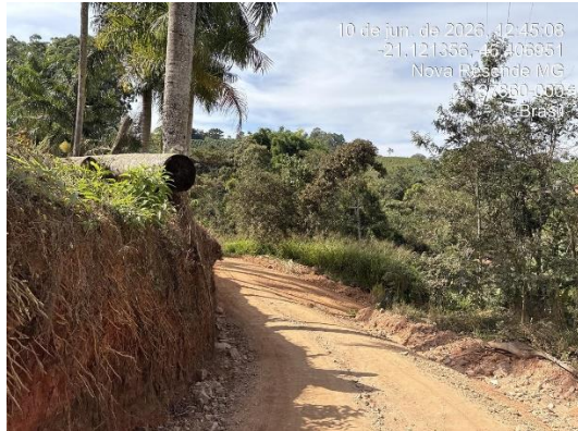
FOTO 07 - Estrada vicinal de Nova Resende ao Bairro Mundo Novo.

Praça Santa Rita, 50 - Centro - CEP: 37.860-000 – Nova Resende – MG CNPJ: 18.187.823/0001-33 - Telefone: (035) 3562-3750