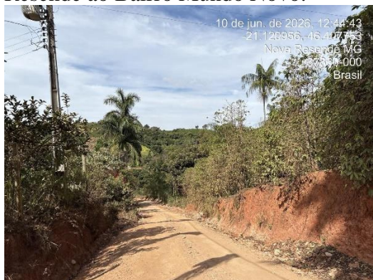
FOTO 03 - Estrada vicinal de Nova Resende ao Bairro Mundo Novo.