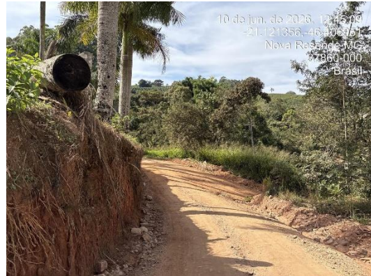
FOTO 08 - Estrada vicinal de Nova Resende ao Bairro Mundo Novo.