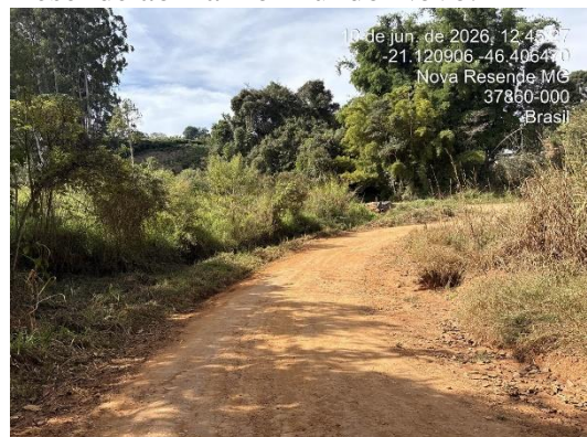
FOTO 12 - Estrada vicinal de Nova Resende ao Bairro Mundo Novo.