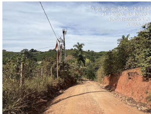
FOTO 02 - Estrada vicinal de Nova Resende ao Bairro Mundo Novo.