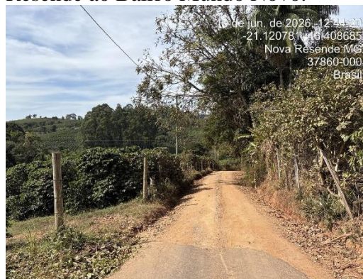
FOTO 04 - Estrada vicinal de Nova Resende ao Bairro Mundo Novo.