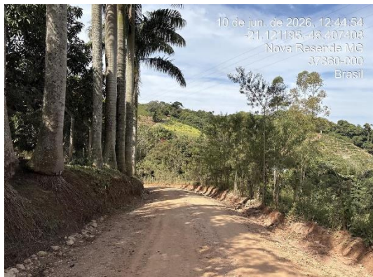
FOTO 13 - Estrada vicinal de Nova Resende ao Bairro Mundo Novo.