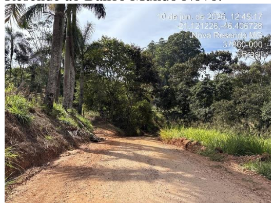
FOTO 10 - Estrada vicinal de Nova Resende ao Bairro Mundo Novo.