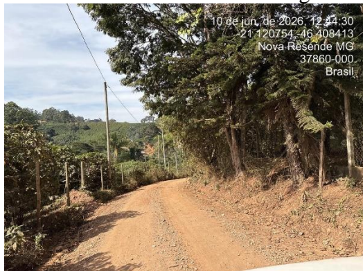
FOTO 01 - Estrada vicinal de Nova Resende ao Bairro Mundo Novo.

As fotografias serão organizadas em ordem sequencial, numeradas de acordo com o sentido de deslocamento ao longo do trecho.