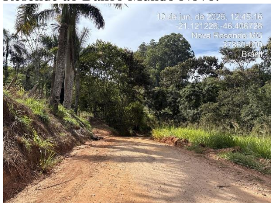
FOTO 09 - Estrada vicinal de Nova Resende ao Bairro Mundo Novo.