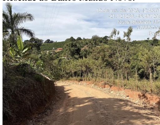
FOTO 06 - Estrada vicinal de Nova Resende ao Bairro Mundo Novo.