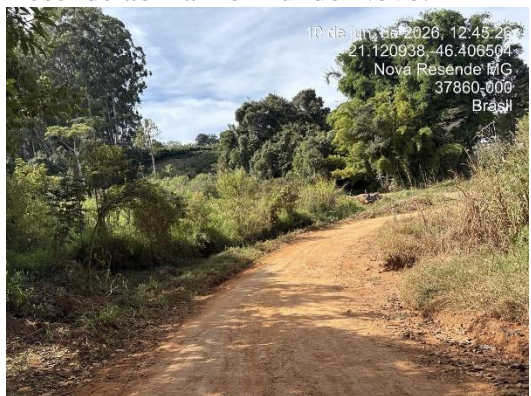
FOTO 11 - Estrada vicinal de Nova Resende ao Bairro Mundo Novo.