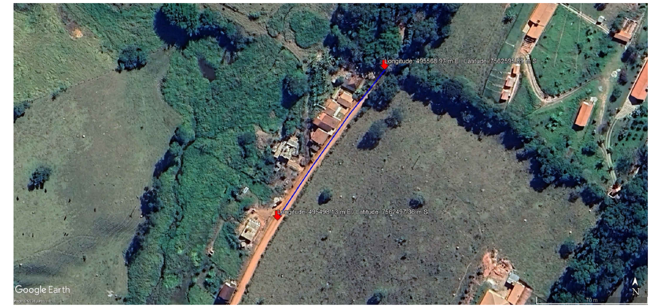
LOCALIZAÇÃO VIA SATÉLITE SEM ESCALA