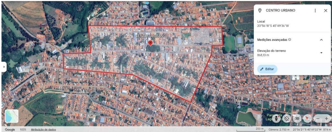
Figura 4: Centro urbano.

PREFEITURA MUNICIPAL DE ILICÍNEA Estado de Minas Gerais CNPJ: 18.239.608/0001-39 Praça. Padre João Lourenço Leite, 53 – Centro – Ilicinea Tel. (fax).: (35) 3854 – 1319 CEP: 37175 -000