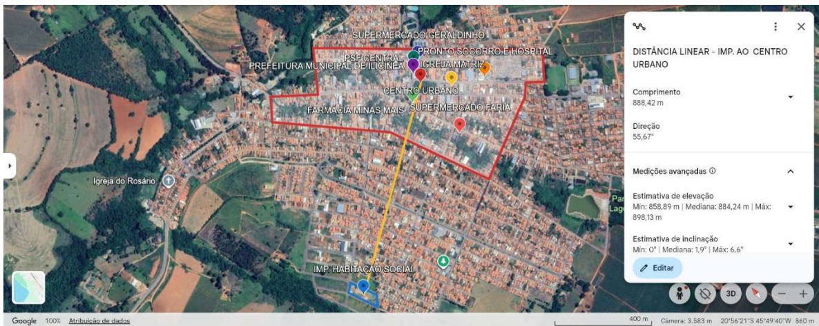
Figura 6: Distância da área de implantação ao centro urbano.