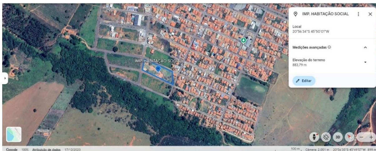
Figura 1: Localização da implantação das habitações sociais.

A seguir, são apresentadas as imagens que contemplam todas as localizações necessárias para a compreensão da implantação do empreendimento.