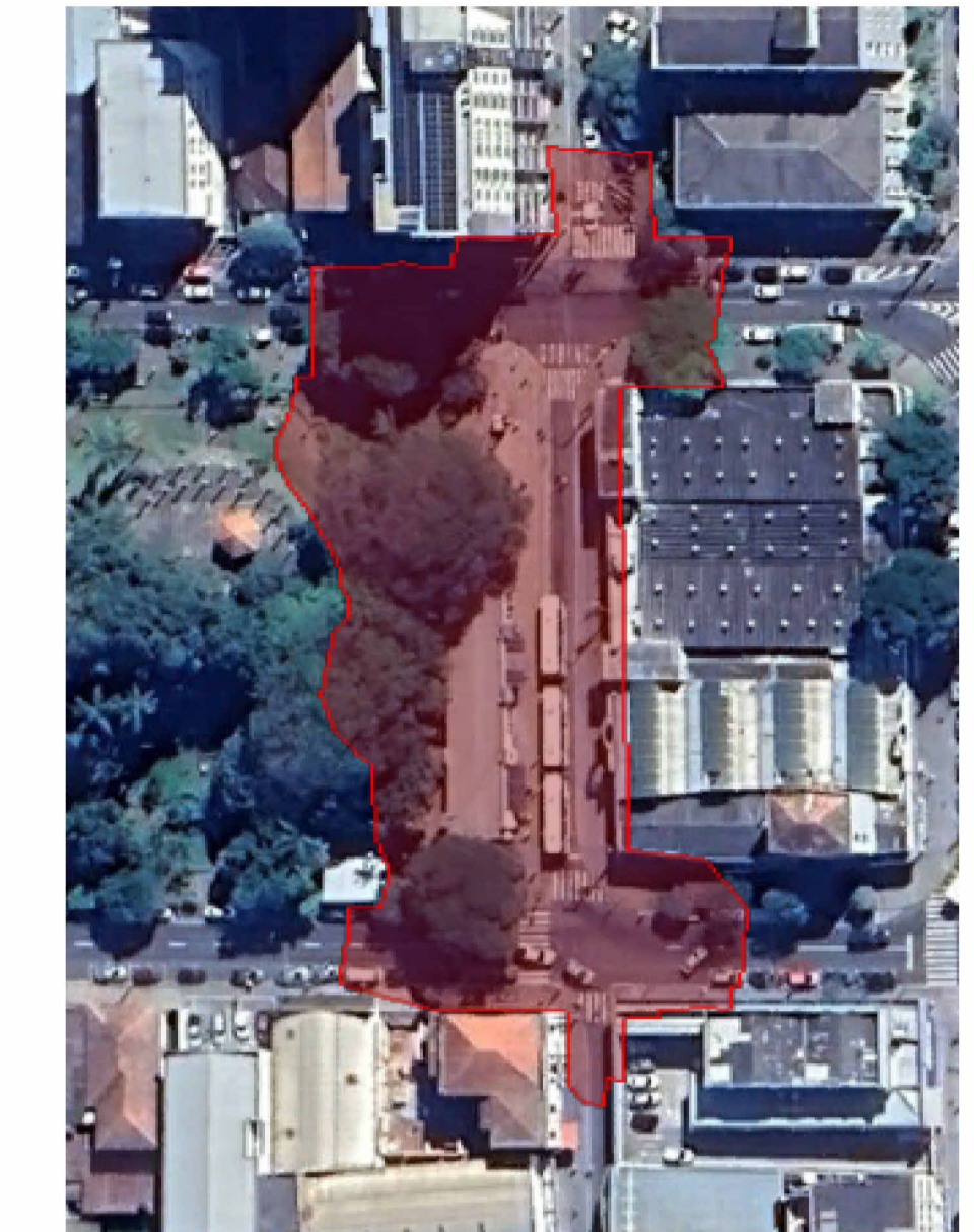
PLANTA DE SITUAÇÃO