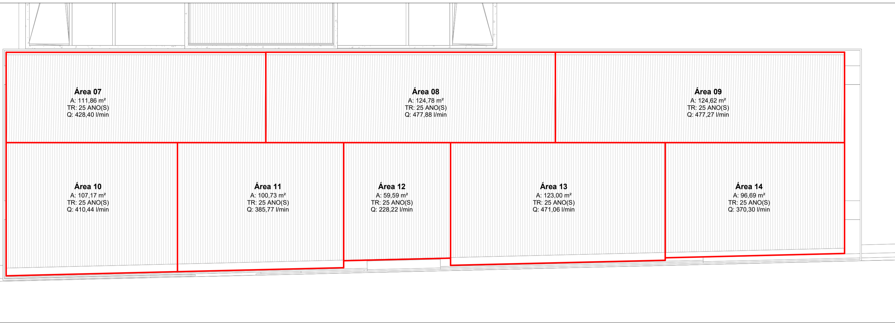
MAPA DE ÁREAS - COBERTURA METÁLICA